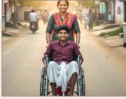
परिवारों को राहत भत्ता मिलेगा। मुख्यमंत्री रेखा गुप्ता ने कहा कि तीन दशकों से अपने घरों से दूर रह रहे कश्मीरी हिन्दू विस्थापितों के जीवन में यह फैसला नई किरण लेकर आएगा।

सदस्य या नजदीकी हो सकता है। ऐसे लोगों के लिए सरकार यह सहायता योजना लेकर आई है। अगर किसी भी समय आवेदक द्वारा दी गई जानकारी में असत्यता मिली तो कानूनी कार्रवाई के साथ जारी की गई राशि को वापस वसूला जाएगा। सभी कश्मीरी विस्थापित परिवारों को राहत भत्ता: इसके साथ ही, कश्मीरी विस्थापितों को मिलने वाले राहत भत्ते को लेकर दिल्ली सरकार ने गुरुवार को अहम निर्णय लिया। सरकार ने इनकी राहत राशि की प्रक्रिया को आसान करते हुए पारिवारिक आय सीमा को खत्म कर दिया है। फैसले के बाद सभी पंजीकृत कश्मीरी विस्थापित