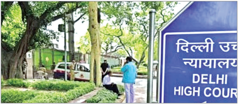
एमसीडी ने कहा, कार्रवाई जारी : दिल्ली नगर निगम (एमसीडी) ने जवाब दाखिल करते हुए कहा कि सभी संपतियों का निरीक्षण किया गया है। कुछ संपतियों में पाया गया है कि बिल्डिंग प्लान के एवज में गलत ब्याजबाजी की गई थी। एक संपत्ति पर पांच भवन योजनाओं को मंजूरी दी गई थी, लेकिन निरीक्षण के दौरान गड़बड़ी पाए जाने पर इनके खिलाफ अनधिकृत निर्माण की श्रेणी में प्रक्रिया शुरू कर दी गई है। मामले में हाईकोर्ट ने एमसीडी को कार्रवाई करने को कहा है। वहीं, इन इमारतों के मालिकों को भी स्वतंत्रा दी है कि यदि उन्हें लगता है कि उनके द्वारा किया गया निर्माण सही है तो वह भी न्यायालय में अपना पक्ष रख सकते हैं।

जगहों पर अवैध निर्माण की शिकायत करने वाले व्यक्ति की सभी याचिकाएं खारिज कर दीं। हालांकि, बेंच ने अपने फैसले में यह भी कहा कि बेशक किसी व्यक्ति विशेष को इस तरह के अवैध निर्माण की शिकायत करने का अधिकार नहीं है, लेकिन अवैध निर्माण पाए जाने पर एमसीडी को इन संपतियों पर कार्रवाई करनी चाहिए।