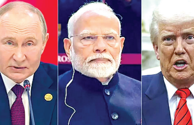
रूसी राष्ट्रपति ने कहा कि हम यूरोप के बढ़ते सैन्यीकरण पर कड़ी नजर रख रहे हैं। रूस द्वारा जवाबी कार्रवाई में ज्यादा समय नहीं लगेगा। ऐसे खतरों का जवाब बहुत महत्वपूर्ण होगा। उन्होंने आगे कहा कि रूस कभी भी कमजोरी या अनिर्णय नहीं दिखाएगा। गौरतलब है कि डेनमार्क में ड्रोन के

रूस और यूक्रेन के बीच तीन साल से अधिक समय से युद्ध जारी है। दोनों देश एक-दूसरे पर लगातार हमले कर रहे हैं। इस बीच रूस के राष्ट्रपति पुतिन ने एक अहम एलान किया है। दरअसल, रूसी राष्ट्रपति व्लादिमीर पुतिन ने गुरुवार को दक्षिणी रूस में एक विदेश नीति मंच को संबोधित करते हुए यूरोप के सैन्यीकरण का महत्वपूर्ण जवाब देने का वादा किया है। चूंकि रूस से यूक्रेन में सेना भेजने के बाद रूस और यूरोपीय संघ के बीच संबंधों में गिरावट आ गई है। इसके कारण यूरोपीय संघ को अपनी रक्षा को मजबूत करना पड़ा। क्या बोले रूस के राष्ट्रपति पुतिन?