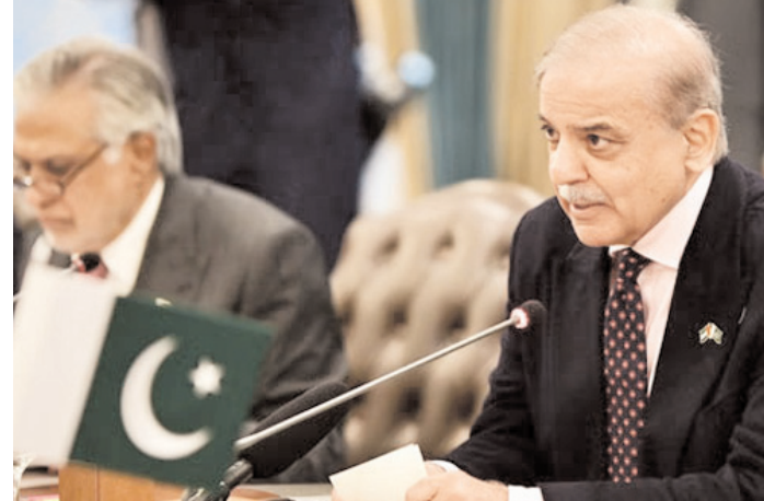
शरीफ की तरफ से भेजी गई आठ सदस्यीय समिति में केंद्रीय मंत्री अहसन इकबाल, आमीर मुकाम, सरदार मोहम्मद युसुफ, राणा सनाउल्ला, डॉ. तारिक फजल चौधरी, पीपीपी के नेता राजा परवेज अशरफ, क्रमर जमां कैरा पूर्व

मुजफ्फराबाद, एजेंसी। पाकिस्तान अधिकृत जम्मू-कश्मीर (पीओजेके) में बीते कई दिनों से चल रहे हिंसक प्रदर्शन के चलते हालात बेकाबू और बेहद तनावपूर्ण बने हुए हैं। इन प्रदर्शनों में पाकिस्तानी सुरक्षा बलों की कार्रवाई से अब तक कम से कम दस लोगों की मौत हो चुकी है, जबकि कई अन्य गंभीर रूप से घायल हैं। ऐसे में हिंसा के दिन-प्रतिदिन बढ़ते स्वरूप के मद्देनजर पाकिस्तान के प्रधानमंत्री शाहबाज शरीफ हरकत में आते हुए नजर आ रहे हैं। इसके तहत उन्होंने स्थिति को नियंत्रित करने के लिए एक उच्चस्तरीय वार्ताकार समिति को पीओजेके भेजा है। बता दें कि प्रधानमंत्री शाहबाज