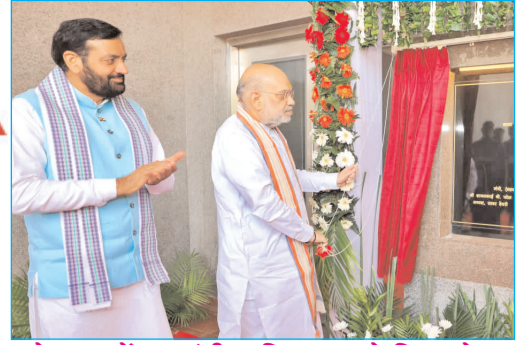
रोहतक में गृह मंत्री अमित शाह ने किया देश के सबसे बड़े अमूल डेयरी प्लांट का उद्घाटन