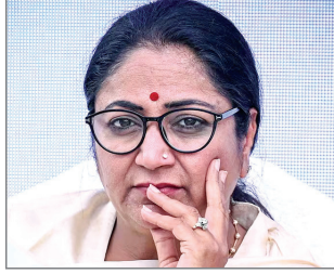
चिह्नित करने के निर्देश सरकार ने दिए हैं। दिल्ली में बेहतर तालमेल के साथ काम करने के लिए सरकार द्वारा जिलों की संख्या बढ़ाकर 11 से 13 किए जा रहे हैं। इनमें से एक जिला एनडीएमसी क्षेत्र दिल्ली छावनी क्षेत्र को मिलाकर होगा। वहीं, 12 जिले निगम के प्रत्येक जोन के क्षेत्र के बराबर होंगे।

नई दिल्ली, एजेंसी। राजधानी दिल्ली में लोगों की समस्याओं के जल्द समाधान के लिए मिनी सचिवालय बनाने की योजना पर काम शुरू हो गया है। पहले चरण में तीन मिनी सचिवालय बनाने के लिए स्थान भी चिह्नित कर लिए गए हैं। यह मिनी सचिवालय पूर्वी, दक्षिण-पश्चिम और नई दिल्ली में बनेंगे। इन स्थानों के बारे में दिल्ली सरकार को जानकारी दे दी गई है। उनके निर्देश पर जल्द ही यहाँ कार्यालय बनाने का काम शुरू होगा। अन्य जिलों में भी जल्द मिनी सचिवालय के लिए स्थान