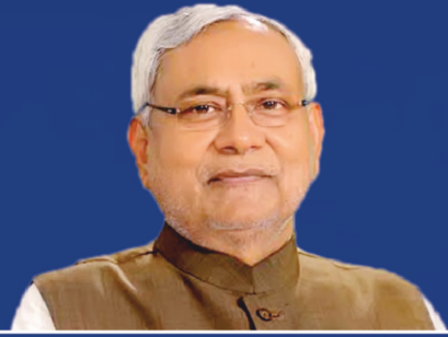
श्री नीतीश कुमार मुख्यमंत्री, बिहार