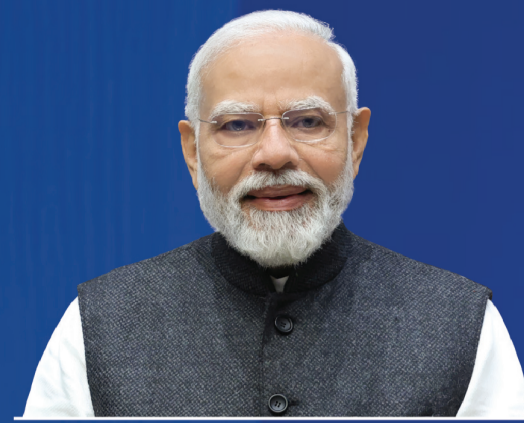
श्री नरेन्द्र मोदी प्रधानमंत्री