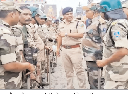
पहुंचा। कर्बला चौक के बाद रांची के चर्च रोड, काली मंदिर रोड होते हुए हर उस स्थान से पुलिस का काफिला गुजरा जहां कभी ना कभी सांप्रदायिक ताकतें मजबूत होने की कोशिश कर चुकी हैं। फ्लैग मार्च के दौरान ही वैसे तमाम

नवबिहार टाइम्स ब्यूरो रांची। दुर्गा पूजा को लेकर रांची पुलिस अलर्ट है। शहर की सुरक्षा को चाक-चौबंद तो की ही जा रही है वहीं दूसरी तरफ रविवार को राजधानी के सभी संवेदनशील स्थानों पर रांची पुलिस और केंद्रीय बलों ने एक साथ फ्लैग मार्च किया। राजधानी में नवरात्र को लेकर पुलिस की टीम पूरी तरह से सजग है। एक तरफ जहां रांची के सीनियर एसपी खुद रात के समय सुरक्षा व्यवस्था पर नजर रख रहे हैं वहीं असाामाजिक तत्वों को चेतावनी देने के लिए शहर में फ्लैग मार्च भी किया जा रहा है। रांची के अल्बर्ट एक्का चौक से शुरू होकर फ्लैग मार्च मेन रोड होते हुए कर्बला चौक तक