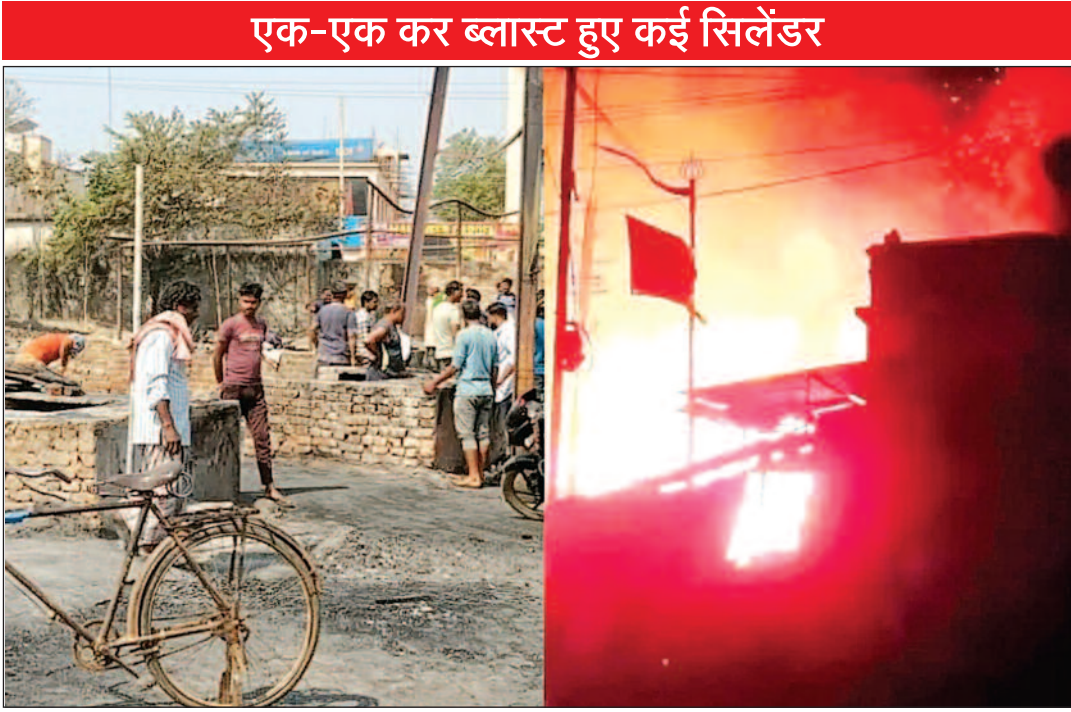
एक-एक कर ब्लास्ट हुए कई सिलेंडर

देवघर/नवबिहार टाइम्स संवाददाता। झारखंड में भीषण आग की घटना सामने आई है। यहां देवघर जिले के जसीडीह-चकाई मुख् पथ पर अवस्थित अस्थायी बस पड़ाव के पास देर रात भीषण आग लग जाने से दर्जनों दुकानें अस्थायी दुकानों जलकर खाक हो गईं। आग से लाखों की संपत्ति भी जलकर खाक हो गई। बताया जा रहा है कि झोपड़ी की शक्ल में बने होटल और दुकानों में रखे गैस सिलेंडर ब्लास्ट होने से आग ने देखते ही देखते विकराल रूप धारण कर लिया। आग इतनी भयानक थी कि दुकान संचालक, परिवारजन और कर्मियों को जान बचाकर भागना पड़ा। बताया जाता है कि होली पर्व के कारण बाजार बंद था, जिससे किसी तरह की जनहानि तो नहीं हुई, लेकिन दुकानदारों को भारी नुकसान उठाना पड़ा। घटना की जानकारी मिलते ही दमकल की गाड़ियां मौके पर पहुंचीं और घंटों कड़ी मशक्कत के बाद आग पर काबू पाया जा सका। अहले सुबह जब दुकानदार अपनी दुकानों पर पहुंचे, तो खाक हो चुकी संपत्ति देखकर मायूस हो गए। बताया जाता है कि होली के पर्व को लेकर लगभग सभी झोपड़पट्टी वाली दुकानें बंद थीं जबकि दो होटल संचालक अंदर सोए थे। उस दौरान लगी आग की लपटें देख होटल छोड़कर सबों ने अपनी जान बचाई।