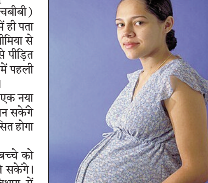
जिसे एमनियोसेंटिसिस (एमनियोटिक द्रव का नमूना लेने की विधि) कहा जाता है। फिर उसे जांच के लिए ले जाया जाता है। जांच में सबसे पहले पानी से डीएनए निकालकर अलग कर लिया जाता है और फिर उसकी एचबीबी जीन सिक्वेसिंग की जाती है, जो थैलेसीमिया या अन्य रक्त विकार जैसे सिकल सेल एनीमिया या नहीं। थैलेसीमिया से ग्रस्त बच्चे की उम्र अधिक नहीं होती है। डॉक्टरों के अनुसार अधिकतम आयु 20 से 25 वर्ष हो सकती है। इसमें भी कान्फि कट के साथ पीड़ित को जीना पड़ता है। बचपन से ही

रांची। अब राज्य में बीटा-ग्लोबिन (एचबीबी) जीन की सिक्वेसिंग जांच से गर्भावस्था में ही पता चल जाएगा कि होने वाला बच्चा थैलेसीमिया से पीड़ित होगा या सिकल सेल एनीमिया से पीड़ित होगा। एचबीबी जीन की स्क्रीनिंग राज्य में पहली बार सरकारी संस्था रिम्स में शुरू हुई है। इससे थैलेसीमिया या रिम्स दंपतियों को एक नया वरदान मिला है। जांच के बाद वे यह जान सकेंगे कि होने वाला बच्चा किसी बीमारी से ग्रस्त होगा या नहीं। यदि जांच रिपोर्ट पॉजिटिव आता है तो बच्चे को रखने या नहीं रखने का निर्णय दंपती ले सकेंगे। रिम्स के जेनेटिक एंड जीनोमिक्स विभाग में पहली बार प्री-नेटल जांच की व्यवस्था शुरू की गई है। रिम्स में यह जांच सेंगर सिक्वेसिंग मशीन के माध्यम से हो शुरू हो पाया है। यह सरकार के महत्वाकांक्षी योजनाओं में से एक है, जिससे ऐसे खरनाक बीमारियों का जन्म होने के पहले ही रोका जा सकेगा। यह जांच गर्भावस्था के 15 से 20 हफ्ते में हो सकेगी, जिसमें डीएनए की मदद से पता चल सकेगी बीमारी के बारे में। सबसे पहले यह देखा जाता है कि पति और पत्नी में कौन थैलेसीमिया से पीड़ित है। यदि दोनों पीड़ित पाए जाते हैं तो फिर गर्भावस्था में गर्भवती के गर्भ से विशेष विधि से पानी निकाला जाता