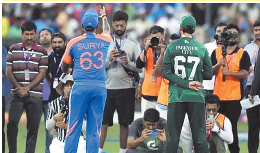
शेष रहते जीत लिया और फाइनल रस में अपनी पकड़ मजबूत की।