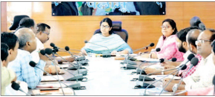
एनएफएसए अंतर्गत माह अक्टूबर 25 का खाद्यान्न के उठाव व डीएसडी की गोदामवार समीक्षा की। पीवीटीजी समूहों के बीच राशन वितरण की भी हुई समीक्षा बैठक में उपायुक्त ने