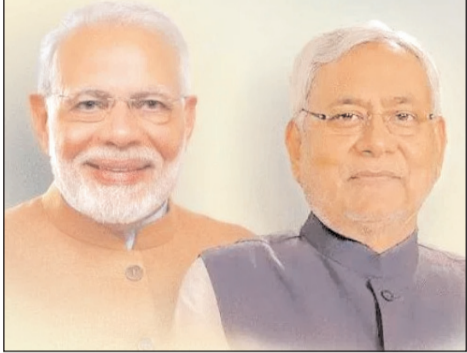
हालांकि जिन महिलाएं अभी तक जीविका से नहीं जुड़ी हैं, उनके लिए भी यह अवसर खुला है। उन्हें पहले स्वयं सहायता समूह की सदस्यता लेनी होगी। सदस्य बनने की

उद्देश्य महिलाओं को स्वरोजगार के अवसर देकर आत्मनिर्भर बनाना है। इस पहल से न केवल उनकी आर्थिक स्थिति मजबूत होगी बल्कि वे अपने परिवार और समाज में भी सम्मानजनक स्थान हासिल कर सकेंगी। खास बात यह है कि रोजगार शुरू करने के बाद महिलाओं को उनके व्यवसाय की प्रगति के आधार पर दो लाख रुपये तक की अतिरिक्त वित्तीय सहायता भी दी जाएगी। यह कदम महिलाओं को लंबे समय तक मजबूत आर्थिक आधार देने में सहायक साबित होगा। महिला रोजगार योजना का लाभ केवल वही महिलाएं उठा सकती हैं, जो बिहार की स्थायी निवासी हों। इसमें राज्य की ग्रामीण और शहरी-दोनों प्रकार की महिलाएं शामिल हैं। योजना के तहत आर्थिक सहायता पाने के लिए महिलाओं का जीविका स्वयं सहायता समूह से जुड़ा होना अनिवार्य है।