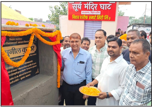
एक महत्वपूर्ण अध्याय है। उन्होंने भावुक होते हुए कहा कि आज अपने बिहारशरीफ परियोजना की उपस्थिति में इस पुनीत कार्य का शुभारंभ करना मेरे लिए अत्यंत हर्ष और गर्व का विषय है। यह इंद्रधनुषी पुल आने वाले समय में यहां के ऐतिहासिक और धार्मिक महत्व

नवबिहार टाइम्स ब्यूरो बिहारशरीफ। बिहारशरीफ विधानसभा क्षेत्र के लिए सोमवार का दिन ऐतिहासिक रहा। लंबे समय से प्रतीक्षित इंद्रधनुषी पुल के निर्माण का सपना अधिकार साकार होने की दिशा में बढ़ गया। सोहसराय स्थित सूर्य मंदिर के सामने पंचाने नदी की शाखा पर इस पुल का शिलान्यास बिहार सरकार में पर्यवरण, वन एवं जलवायु परिवर्तन मंत्री डॉ. सुनील कुमार ने किया। करीब 1 करोड़ 78 लाख रुपये की लागत से बनने वाला यह पुल न केवल स्थानीय लोगों की वर्षा पानी मांग को पूरा करेगा, बल्कि इस क्षेत्र के विकास और पर्यटन को भी नई दिशा देगा। शिलान्यास के अवसर पर मंत्री डॉ. सुनील कुमार ने कहा कि यह पुल सिर्फ एक निर्माण परियोजना नहीं है, बल्कि बिहारशरीफ विधानसभा क्षेत्र की विकास यात्रा का