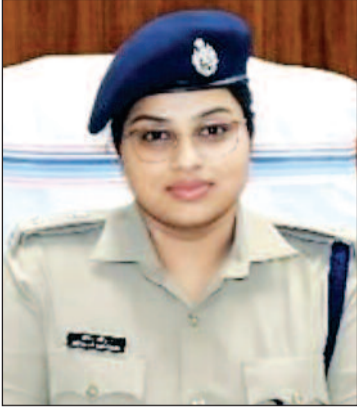
वीडियो पुलिस अधीक्षक को उनके क्लाइंट पर मिला था। पुलिस अधीक्षक ने इसकी सत्यता की जांच के लिए वीडियो फुटेज को विश्रामपुर अनुमंडल पुलिस