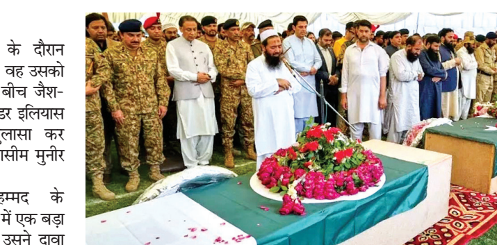
आर्मी चीफ ने दिया था। ध्यान देने योग्य है कि जैश-ए-मोहम्मद के आतंकी कमांडर का ये बयान ऐसे समय पर आया है, जब पाकिस्तान दुनिया के सामने दावा करता आया है कि उसके देश में कोई भी आतंकी ठिकाना नहीं है। एचटी की रिपोर्ट