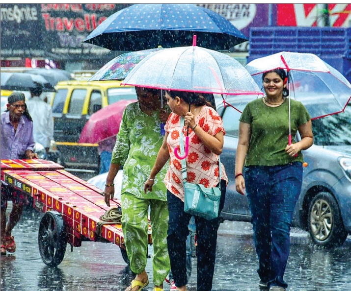
से थोड़ा ऊपर था, लेकिन बारिश की ठंडी हवा ने सब कुछ सहज कर दिया। बारिश एक कमजोर पश्चिमी विक्षोभ और मॉनसून ट्रफ के दक्षिण की ओर खिसकने का नतीजा थी। आईएमडी ने आज दिल्ली

के लिए हल्की बारिश या बूंदबांदी का पूर्वानुमान जारी किया है। सुबह के समय तापमान करीब 26 डिग्री के आसपास रहेगा, जो दोपहर तक 33-34 डिग्री तक चढ़ सकता है। नमी का स्तर 70-80 तक रहने से उमस तो बनी रहेगी, लेकिन बारिश की बूंदें इसे काट देंगी। हवा की गति हल्की (5-10 किमी/घंटा) रहेगी। आईएमडी के मुताबिक, अगले 24 घंटों में 10-20 मिमी बारिश हो सकती है।