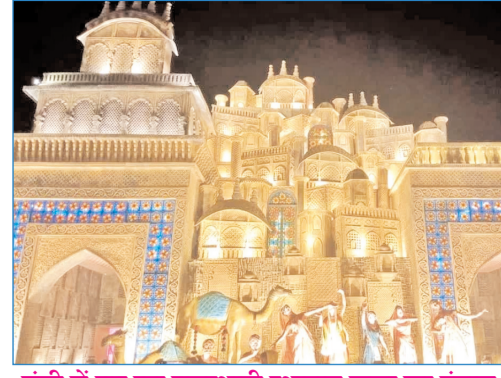
रांची में बन रहा राजस्थानी स्थापत्य कला का पंडाल