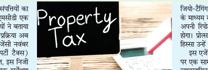
ने कहा, एक बार वित्तीय बोलियां साफ हो जाने के बाद, चुनी गई एजेंसी को यह काम सौंप दिया जाएगा। एजेंसी के पास पूरे शहर में भौतिक सर्वेक्षण करने, संपत्तियों की

नई दिल्ली, एजेंसी। दिल्ली के लोगों की संपत्तियों का सर्वे और टैक्स का नोटिस देने का जिम्मा एमसीडी एक निजी कंपनी को सौंपने जा रही है। अधिकारियों ने बताया कि एक निजी एजेंसी को काम पर रखने की प्रक्रिया अब अंतिम चरण में है, और उम्मीद है कि यह एजेंसी नवंबर तक काम शुरू कर देगी। संपत्ति कर (प्रॉपर्टी टैक्स) वसूली को मजबूत बनाने की योजना के तहत, इस निजी एजेंसी के एजेंट पूरे एमसीडी क्षेत्र में भौतिक सर्वेक्षण करेंगे, संपत्तियों की जियो-टैगिंग करेंगे, और कंप्यूटर से इकट्ठा किए गए स्व-मूल्यांकन डेटा के साथ टैक्स नोटिस देगे। संपत्ति कर विभाग के एक वरिष्ठ एमसीडी अधिकारी