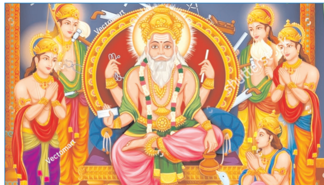
विश्वकर्मा पूजा के अवसर पर हार्दिक शुभकामनाएं

* रजि. नंबर : 52290/90 * वर्ष : 36 * अंक : 112 * पृष्ठ : 12