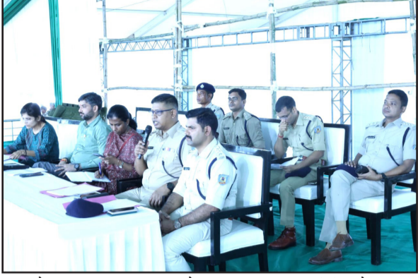
सभी तैयारियाँ पूरी कर ली गई हैं। प्रतिनियुक्त मजिस्ट्रेटों और पुलिस अधिकारियों के साथ संयुक्त ब्रीफिंग की। इस दौरान मंच व्यवस्था, अधीक्षक मनीष टोपे ने सोमवार को

नवबिहार टाइम्स ब्यूरो खूंटी। जिले में विधिक संरचनाओं के विकास की दिशा में ऐतिहासिक कदम के तौर पर आज खूंटी कचहरी मैदान में विधिक परिषद भवन का शिलान्यास किया जाएगा। इस अवसर पर झारखंड के मुख्यमंत्री हेमन्त सोरेन और झारखंड उच्च न्यायालय के मुख्य न्यायाधीश तरलोक सिंह चौहान मुख्य अतिथि के रूप में मौजूद रहेंगे। कार्यक्रम के दौरान मुख्यमंत्री और मुख्य न्यायाधीश वरुण अल माध्यम से चाँडिल और चाँडबासा बाध भवन का भी शिलान्यास करेंगे। जिला प्रशासन की ओर से