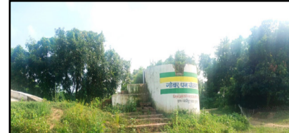
लेकिन ग्रामीणों का कहना है कि गैस में प्रेशर की कमी और लो प्रेस में कारण इससे चाय तक नहीं बन पाता है। दरअसल, हुलासगंज प्रखंड के सूरजपुर पंचायत स्थित भवानीपुर गांव में गोबरधन योजना का शुरुआत की गई। इसका उद्देश्य एलपीजी गैस की निर्भरता कम करना और ग्रामीणों को मुफ्त में गैस पहुंचाना है। प्राप्त जानकारी के अनुसार इस बायोगैस प्लांट की क्षमता 2 मीट्रिक टन है और इसके निर्माण पर 50 लाख रुपए की लागत आई है। इस कंपनी को दो ईके जिम्मेदारी सावित्री रिन्यूएबल एनर्जी प्राइवेट लिमिटेड को कॉन्सी-नवयन एजेंसी के रूप में नियुक्त किया गया है,

डॉ. रंजीत कुमार भारतीय/नबिटा ब्यूरो जहानाबाद। जिले के हुलासगंज प्रखंड अंतर्गत भवानीपुर गांव में परंपरागत ईंधन और एलपीजी गैस के विकल्प के रूप में एक बायोगैस प्लांट लगाया गया है। यह महत्वाकांक्षी योजना अक्षय ऊर्जा के रूप में ऊर्जा के क्षेत्रों में नवीनीकरण को बढ़ावा देगा। गोबरधन योजना के तहत भवानीपुर गांव में गोबर गैस की आपूर्ति शुरू हो गई है। बताया जाता है कि भवानीपुर गांव के अभी 15 घरों में गैस की सप्लाई हो रही है। हालांकि इन घरों को परंपरागत ईंधन के खोतों और एलपीजी गैस की निर्भरता कम करने के लिए गोबर गैस की सप्लाई की जा रही है, लेकिन जमीनी हकीकत कहीं इसके उलट है। ग्रामीणों ने बताया कि अब तक 15 घरों में पाइपलाइन और कनेक्शन तो पहुंचा दिया गया है,