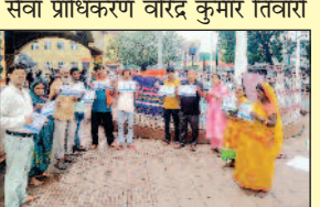
झालसा ने चलाया मध्यस्थता जागरूकता अभियान