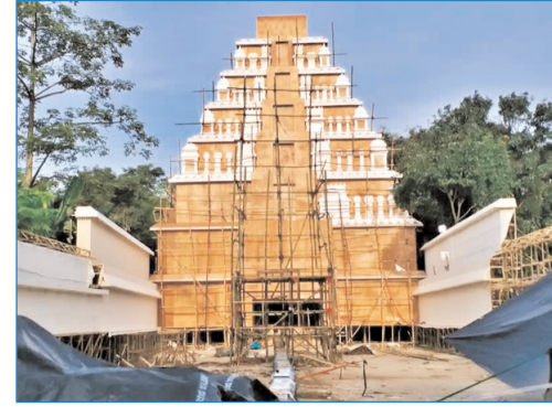
रांची रेलवे स्टेशन के पास बन रहा भव्य पूजा पंडाल