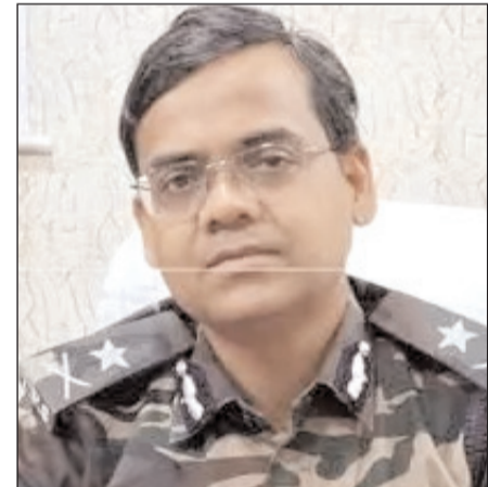
इस अभियान के तहत पुलिस न केवल ढोल-नगाड़े बजाएगी बल्कि बैनर-पोस्टर और विजुअल सामग्री