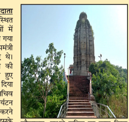
शौचालय, पाथवे सहज का काम किया गया था परंतु आज तक रोपवे का निर्माण नहीं हुआ। क्षेत्र के लोग अब यहाँ क्यास लगा रहे थे है कि आखिरकार उमगा पहाड़ पर कबतक रोपवे का निर्माण कराया जाता है। बता दें कि मदनपुर का उमगा पहाड़