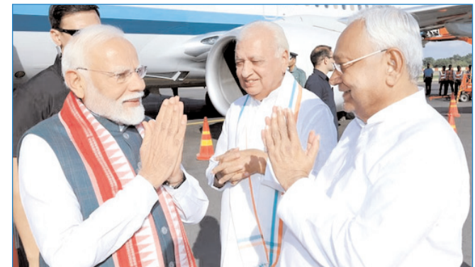
पूर्णिमा के चुनापुर सेन्य हवाई अड्डे पर पीएम नरेन्द्र मोदी का स्वागत करते सीएम नीतीश कुमार

* मूल्य : 3.00 रुपये * औरंगाबाद एवं बोकारो से प्रकाशित * www.navbihartime.com