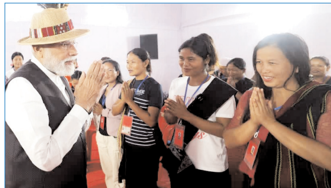
मणिपुर के हिंसा प्रभावित चुराचंदपुर में विस्थापित लोगों से प्रधानमंत्री ने की बातचीत

* रजि. नंबर : 52290/90 * वर्ष : 36 * अंक : 109 * पृष्ठ : 12