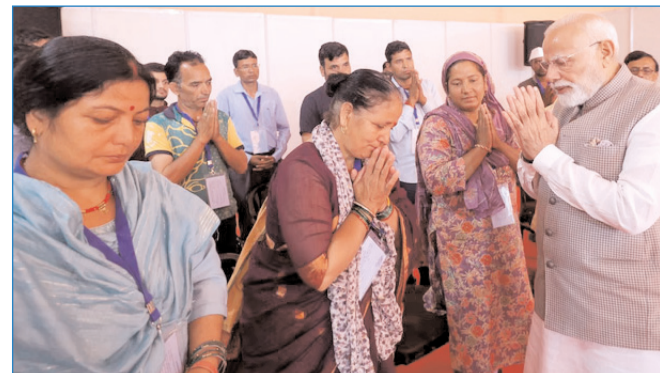
उत्तराखंड में आपदा प्रभावितों से मिलते प्रधानमंत्री नरेंद्र मोदी

* मूल्य : 3.00 रुपये * औरंगाबाद एवं बोकारो से प्रकाशित * www.navbihartime.com