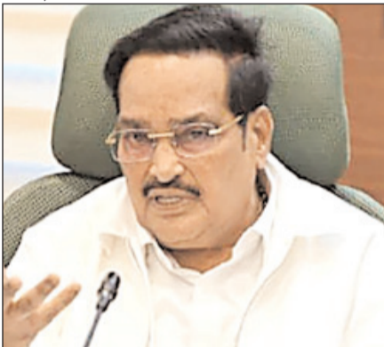
शक्ति मंत्रालय से संबंधित चल रही परियोजनाओं की प्रगति का हवाई सर्वेक्षण किया। भारत सरकार ने इसके लिए 11500 करोड़ के बजट का आवंटन किया है। इस महत्वाकांक्षी योजना से बाढ़ नियंत्रण तो होगा ही, सिंचाई परियोजना से बिहार के लाखों किसान लाभान्वित होंगे। पिछले दिनों केन्द्रीय मंत्रिमंडल ने बिहार