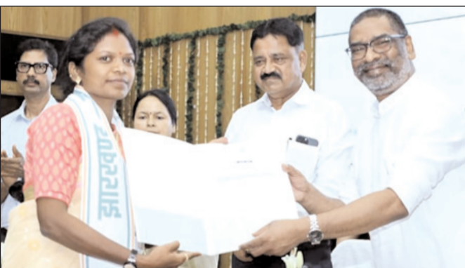
हो रहे हैं। राज्य का सर्वांगीण विकास समुचित विकास हो, इसके लिए आप गठबंधन सरकार की प्रतिबद्धता है। मुख्यमंत्री ने नवनि्युक्त अभ्यर्थियों को मुझे पूरी बधाई और शुभकामनाएं देते हुए कहा कि आप आज से सरकार के एक अभिन्न के रूप में जुड़ रहे हैं। राज्य का

रांची। झारखंड के मुख्यमंत्री हेमंत सोरेन ने नगर विकास एवं आवास विभाग में विभिन्न पदों पर चयनित अभ्यर्थियों को गुरुवार को राजधानी रांची में नियुक्ति पत्र सौंपा। झारखंड मंत्रालय में आयोजित नियुक्ति पत्र वितरण समारोह में मुख्यमंत्री हेमंत सोरेन ने झारखंड पर्यटन तथा झारखंड टूरिज्म डेवलपमेंट कॉरपोरेशन (जेटीडीसी) के लोगो एवं वेबसाइट के साथ-साथ सांस्कृतिक दल प्रबंधन प्रणाली एप्लीकेशन (ऐप) का भी शुभारंभ किया। इस अवसर पर झारखंड के सीएम ने कहा कि राज्य को मजबूत और बेहतर बनाने की दिशा में उनकी सरकार लगातार प्रयासरत है। नियुक्तियों के साथ-साथ सभी सेक्टरों में लगातार कार्य