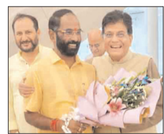
कैबिनेट की बैठक में बिहार के दो नए बड़े प्रोजेक्टों को मंजूरी दी गई है। इसमें मोकामा मुंगेर चार लेन हाईवे 4500 करोड़ रुपये की लागत से बनेगा और भागलपुर-दुमका-रामपुर हाट की रेलवे लाइन में दूसरा ट्रैक बनाना है। उन्होंने कहा कि बिहार की राजधानी पटना में मेट्रो का निर्माण हो रहा है। एनडीए का संकल्प बिहार को विकसित बनाना है, बिहार को सुख-समृद्ध बनाना है। आज जो प्रगति दिख रही है, वह बिहार के उज्ज्वल भविष्य का प्रतीक है। केन्द्रीय

पटना। प्रधानमंत्री नरेंद्र मोदी और मुख्यमंत्री नीतीश कुमार के नेतृत्व में बिहार विकास की ओर बढ़ रहा है। एक समय था जब बिहार में भ्रष्टाचार सुर्खियों में था और आज आधारभूत संरचनाओं की योजनाएं, औद्योगिक विकास दिखाई दे रहा है। एक प्रकार से यहां विकास की लहर दिखाई दे रही है। यह बात केन्द्रीय मंत्री पीयूष गोयल ने गुरुवार को प्रदेश भाजपा कार्यालय में आयोजित एक प्रेस वार्ता को संबोधित करते हुए कही। श्री गोयल ने कहा कि एक बार फिर से बिहार में नीतीश कुमार के नेतृत्व में एनडीए की सरकार स्थापित करने के लिए हमलोग मैदान में उतरे हैं। दावा करते हुए कहा कि आने वाले चुनाव में जनता के आशीर्वाद से एनडीए और रैलियों के बाद राज्य की सियासत का पारा और भी ऊपर चढ़ने वाला है।