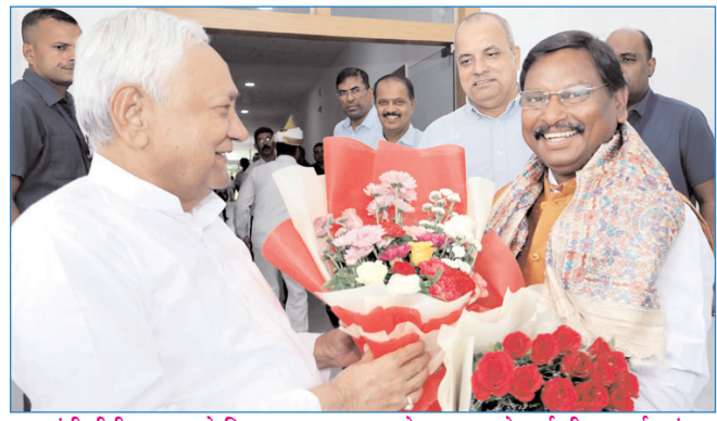
मुख्यमंत्री नीतीश कुमार से शिष्टाचार मुलाकात करते झारखंड के पूर्व सीएम अर्जुन मुंडा

* मूल्य : 3.00 रुपये * औरंगाबाद एवं बोकारो से प्रकाशित * www.navbihartime.com