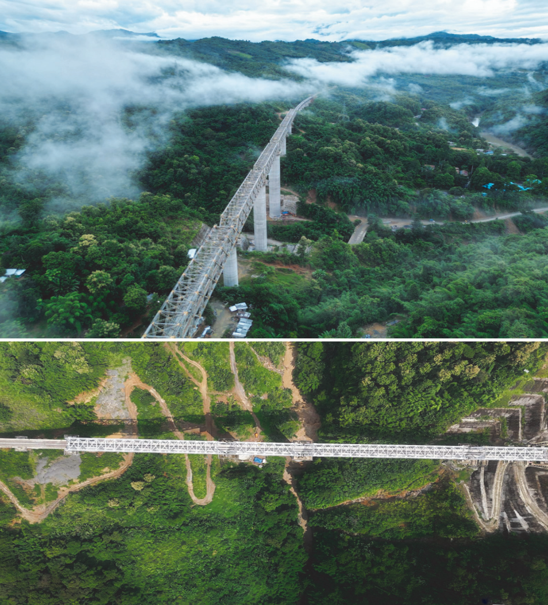
निर्माण कार्य की उपलब्धियाँ

परियोजना का सबसे उल्लेखनीय इंजीनियरिंग चमत्कार है पुल संख्या 196 का पियर क्र 4, जिसकी ऊँचाई 114 मीटर है। यह कुतुब मीनार से भी 42 मीटर ऊँचा है। इसके अतिरिक्त, यात्रियों और माल ढुलाई की सुगमता के लिए 5 रोड अंडरब्रिज (ऋहक) और 6 रोड अंडरब्रिज (ऋक) का भी निर्माण किया गया है।