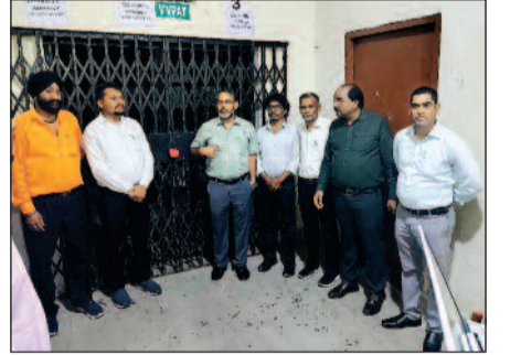
तैनात सशस्त्र सुरक्षा बलों को अपने कार्य एवं दायित्वों के प्रति सचेत व सक्रिय रहने के निर्देश दिए। मौके पर उप निर्वाचन पदाधिकारी, सभी राजनीतिक दलों के प्रतिनिधि व अन्य संबंधित अधिकारी उपस्थित थे।

गिरिडीह/नवबिहार टाइम्स संवाददाता। जिला निर्वाचन पदाधिकारी-सह-उपायुक्त, श्री रामनिवास यादव के द्वारा प्रखंड कार्यालय गिरिडीह स्थित इवीएम वीवीपैट वेयरहाउस का त्रैमासिक निरीक्षण किया गया। उन्होंने इवीएम वेयर हाउस की विधि व्यवस्था से संबंधित आवश्यक पहलुओं की जांच की। इवीएम वेयर हाउस की सुरक्षा व्यवस्था की जानकारी ली। उपायुक्त ने सीसीटीवी व अन्य उपकरणों की स्थिति और रखरखाव का जांच लिया। सीसीटीवी कंट्रोल रूम का भी निरीक्षण किया। इसके अलावा निरीक्षण दौरान जिला निर्वाचन पदाधिकारी द्वारा परिसर का अवलोकन के क्रम में सुरक्षा व्यवस्था, विद्युत व्यवस्था, बीयू हॉल, सीसीटीवी कंट्रोल रूम, जनरेटर रूम, तैनात सुरक्षा बलों के लॉग बुक, आनिशमन यंत्र आदि सहित अन्य व्यवस्थाओं तथा कर्मों के सीलिंग आदि का जांचा लिया गया। निरीक्षण के क्रम में