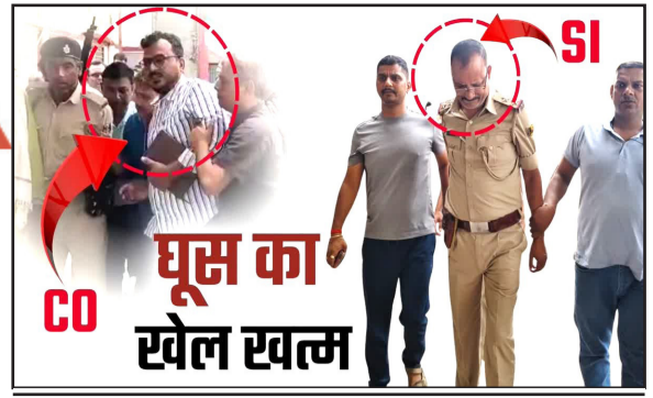
बिहार में सीओ और एसआई गिरफ्तार