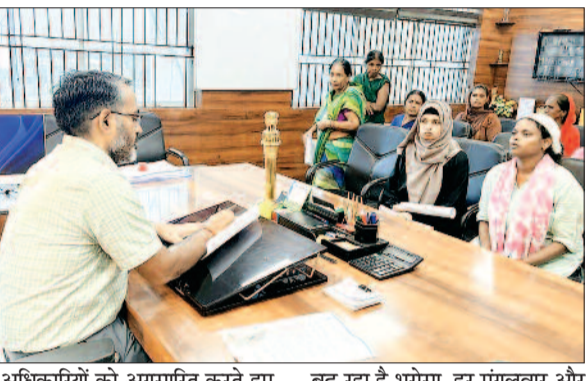
अधिकारियों को अग्रसारित करते हुए यथोचित कार्रवाई के निर्देश दिए गए।

गिरिडीह/नवबिहार टाइम्स संवाददाता। साप्ताहिक जनता दरबार का आयोजन, प्राप्त शिकायतों पर जांचोपरांत यथोचित कार्रवाई का मिला आश्वासना जनता दरबार के प्रति आमजनों का बढ़ रहा है भरोसा, हर मंगलवार और शुक्रवार को जो सी ज्यदा लोग जनता दरबार में पहुंच रहे हैं, अपनी शिकायतों से उपायुक्त को अवगत करा रहे हैं जनता दरबार में प्राप्त शिकायतों को जन समाधान पोर्टल के माध्यम से संबंधित विभाग को भेज कर त्वरित निराकरण सुनिश्चित कराया जाता है जिला प्रशासन द्वारा आम जनता की समस्याओं के त्वरित समाधान और सुशासन को बढ़ावा देने के उद्देश्य से प्रत्येक मंगलवार एवं शुक्रवार को जनता दरबार का आयोजन किया जा रहा है।