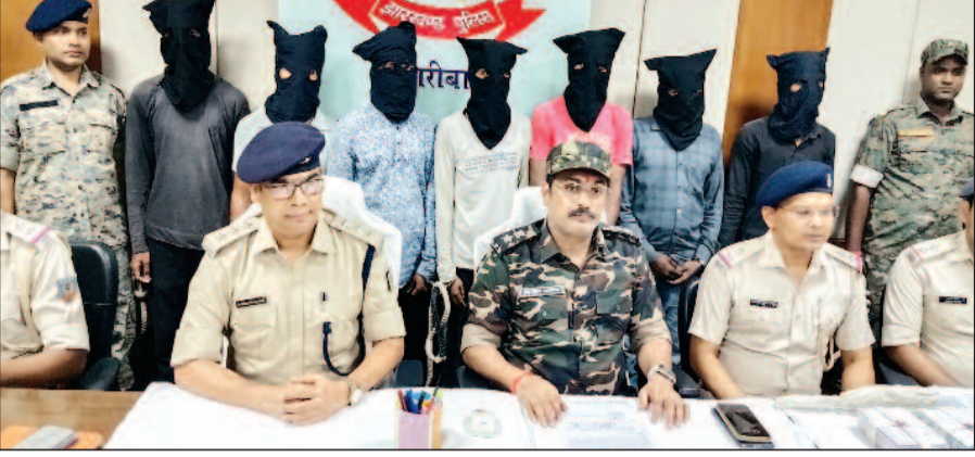
गिरफ्तार अपराधियों के नाम