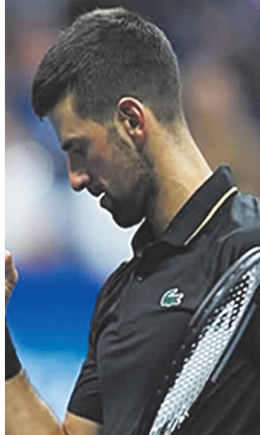
सबसे महत्वपूर्ण टूर्नामेंट हैं। नोवाक जोकोविच ने कहा, मैं अपने टेनिस के स्तर से खुश हूँ,

न्यूयॉर्क, एजेंसी। यूएस ओपन के सेमीफाइनल में नोवाक जोकोविच को कालोस अल्काराज के खिलाफ शिकस्त झेलनी पड़ी, जिसके बाद सर्वियाई खिलाड़ी ने संन्यास की अटकलों को खारिज कर दिया। जोकोविच ने पुष्टि की है कि वह अगले साल एक पूर्ण ग्रैंड स्लैम सीजन खेलना चाहते हैं। 22 वर्षीय स्पेनिश खिलाड़ी कालोस अल्काराज ने 38 वर्षीय सर्वियाई खिलाड़ी को 6-4, 7-6(4), 6-2 से शिकस्त देकर अपने सारतों और न्यूयॉर्क में दूसरे मेजर फाइनल में प्रवेश किया है। आर्थर एश स्टेडियम में करीब 2 घंटे 25 मिनट तक चलने वाले रोमांचक मुकाबले में कालोस अल्काराज ने इस साल के ऑस्ट्रेलियन ओपन और 2024 पेरिस ओलंपिक में जोकोविच से मिली हार का बदला लिया। सर्वियाई खिलाड़ी नोवाक जोकोविच ने कहा, मैं अब भी ग्रैंड स्लैम खेलना चाहता हूँ। मैं अगले साल पूरा ग्रैंड स्लैम सीजन खेलना चाहता हूँ। देखते हैं कि ऐसा होता है या नहीं। लेकिन स्लैम तो स्लैम होते हैं। यह किसी भी अन्य टूर्नामेंट से अलग है। ये हमारे खेल के स्तंभ हैं। यह हमारे