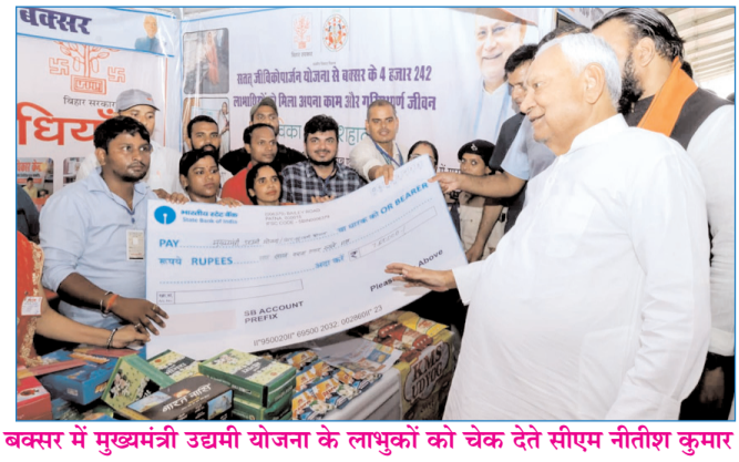
बक्सर में मुख्यमंत्री उद्यमी योजना के लाभुकों को चेक देते सीएम नीतीश कुमार

* औरंगाबाद एवं बोकारो से प्रकाशित * www.navbihartime.com