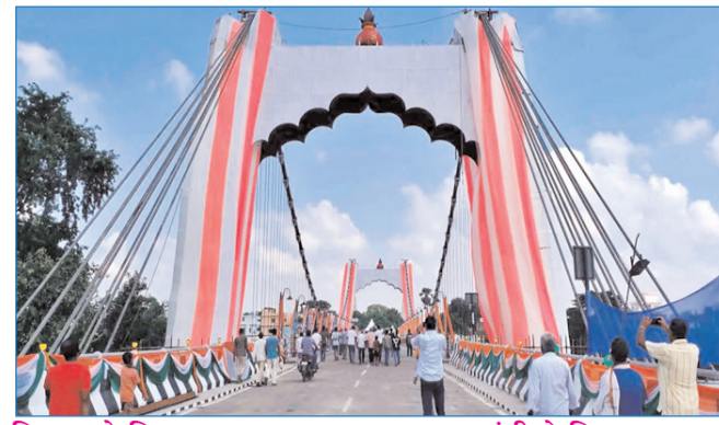
बिहार को मिला पहला लक्ष्मण झूला, मुख्यमंत्री ने किया उद्घाटन

* मूल्य : 3.00 रुपये * औरंगाबाद एवं बोकारो से प्रकाशित * www.navbihartime.com