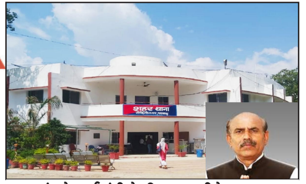
झारखंड के पूर्व मंत्री के खिलाफ जीरो एफआइआर