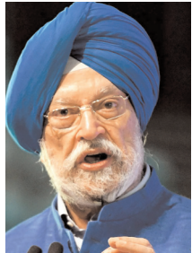
हरदीप एस. पुरी