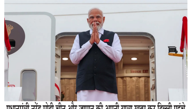
प्रधानमंत्री नरेंद्र मोदी चीन और जापान की अपनी यात्रा खत्म कर दिल्ली पहुंचे

* मूल्य : 3.00 रुपये * औरंगाबाद एवं बोकारो से प्रकाशित * www.navbihartime.com