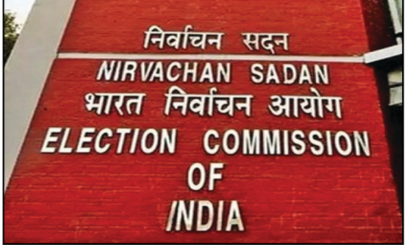
तस्वीरों का उपयोग रिकॉर्ड अपडेट करने में किया जाएगा। गौरतलब करने और नए पहचान पत्र जारी है कि एक अगस्त को प्रकाशित

नवबिहार टाइम्स ब्यूरो नई दिल्ली। बिहार में मतदाता सूची के विशेष गहन पुनरीक्षण कार्य पूरा होने के बाद राज्य के सभी मतदाताओं को नया मतदाता पहचान पत्र जारी किया जाएगा। निर्वाचन आयोग ने रविवार को इस योजना का आदेश जारी किया। हालांकि नए पहचान पत्र जारी करने की तिथि पर अभी अंतिम निर्णय नहीं लिया गया है। आयोग के अधिकारियों ने बताया कि मतदाताओं से गणना प्रपत्र भरवाने के साथ ही नई तस्वीर जमा करने को कहा गया है। इन