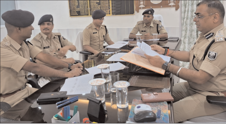
प्रतिनियुक्ति पर जिला से बाहर रही है, उनकी पदस्थापन अवधि में वह अवधि भी जोड़ी गई है।