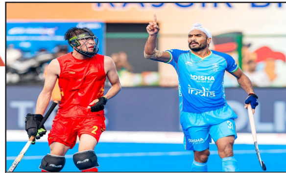
एशिया हॉकी में भारत ने चीन को 4-3 से हराया