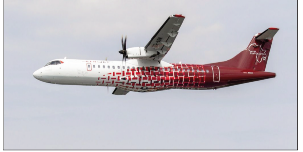
जिला प्रशासन व एयरपोर्ट अधिकारियों को आवश्यक दिशा-निर्देश भी दिए। बाद में डिप्टी सीएम व अन्य नेताओं ने हवाई अड्डा परिसर में ही प्रशासन व एयरपोर्ट अधिकारियों के साथ निदेश भी दिए। बाद में डिप्टी सीएम व अन्य नेताओं ने हवाई अड्डा परिसर में ही प्रशासन व एयरपोर्ट अधिकारियों के साथ निदेश भी दिए। बाद में डिप्टी सीएम व अन्य नेताओं ने हवाई अड्डा परिसर में ही प्रशासन व एयरपोर्ट अधिकारियों के साथ निदेश भी दिए।

नवबिहार टाइम्स संवाददाता पूर्णिया। बिहार के उड़ मख्मत्री सम्राट चौधरी ने कहा कि पूर्णिया एयरपोर्ट का निर्माण कार्य पांच सितंबर तक पूर्ण हो जाएगा। दो दिन बाद यानि एक सितंबर से हवाई यात्रा के लिए बुकिंग भी आरंभ हो जाएगी। प्रधानमंत्री नरेंद्र मोदी 15 सितंबर को पूर्णिया से हवाई सेवा की शुरुआत का शुभारंभ करेंगे। डिप्टी सीएम शुक्रवार को केंद्रीय मंत्री लालन सिंह, जदयू के राष्ट्रीय कार्यकारी अध्यक्ष संजय झा व बिहार सरकार की मंत्री लेखी सिंह के साथ हवाई अड्डा परिसर पहुंचे थे। पटना से सीधे हेलीकाप्टर से पहुंचे डिप्टी सीएम व अन्य नेताओं ने सर्वप्रथम हवाई अड्डा परिसर में चल रहे निर्माण कार्य की स्थिति का जायजा लिया और इस संबंध में