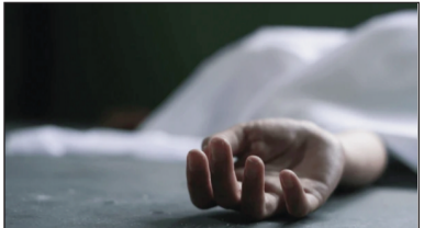
तो हम सब हैरान थे। यह घटना पूरे गांव के लिए एक सदमा है। वह गांव के सांस्कृतिक कार्यक्रमों में बढ़-चढ़कर हिस्सा लेती थी।