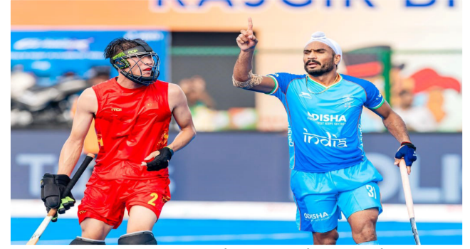
एशिया हॉकी में भारत ने चीन को 4-3 से हराया

* मूल्य : 3.00 रुपये * औरंगाबाद एवं बोकारो से प्रकाशित * www.navbihartime.com