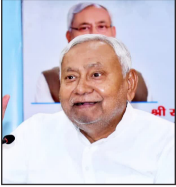
छह माह बाद मिलेगा और सहयोग योजना का स्वरूप केवल शुरुआती आर्थिक

नवबिहार टाइम्स ब्यूरो पटना। बिहार सरकार ने महिलाओं के आर्थिक सशक्तिकरण की दिशा में बड़ा कदम उठाते हुए मुख्यमंत्री महिला रोजगार योजना की शुरुआत की है। ग्रामीण विकास विभाग की ओर से मिली जानकारी के अनुसार, इस योजना का लाभ राज्य के हर परिवार की एक महिला को मिलेगा। उन्हें रोजगार शुरू करने के लिए सीधे आर्थिक सहायता प्रदान की जाएगी। योजना के तहत प्रारंभिक सहयोग के रूप में 10 हजार रुपये की राशि प्रथम किस्त में सीधे लाभार्थियों के बैंक खाते में भेजी जाएगी। आवेदन की प्रक्रिया जल्द ही शुरू की जाएगी और सरकार का लक्ष्य है कि सितम्बर 2025 से ही राशि का हस्तांतरण शुरू कर दिया जाए।