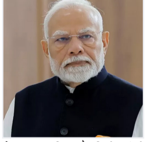
प्रधानमंत्री नरेन्द्र मोदी ने रेलवे परियोजनाओं को राष्ट्र को समर्पित किया।

नवबिहार टाइम्स संवाददाता अहमदाबाद। प्रधानमंत्री नरेन्द्र मोदी ने सोमवार को अहमदाबाद में आयोजित एक भव्य कार्यक्रम में 1,400 करोड़ रुपये से अधिक की विभिन्न रेलवे परियोजनाओं का लोकार्पण एवं राष्ट्र को समर्पण किया। इन परियोजनाओं से उत्तर गुजरात के महेशणा, पाटण, बनासकांट, गांधीनगर और अहमदाबाद जिलों को सीधा लाभ मिलेगा। प्रधानमंत्री ने इस मौके पर कहा कि ये परियोजनाएं क्षेत्रीय कनेक्टिविटी, औद्योगिक विकास, लॉजिस्टिक्स दक्षता और रोजगार सृजन को नई ऊंचाई देंगी। उद्घाटित योजनाओं में 537 करोड़ रुपये की लागत से बनी महेशणा-पालनपुर रेल लाइन (65 किमी) का दोहरीकरण, 347 करोड़ रुपये की लागत से कलोल-कड़ी-कटोसन रोड रेल लाइन (37 किमी) का गेज कन्वर्जन और 520 करोड़ रुपये की लागत से बेचराजी-रगुंज रेल लाइन (40 किमी) का गेज कन्वर्जन शामिल है। इन परियोजनाओं से उत्तर गुजरात को ब्रांडेज लाइन के माध्यम