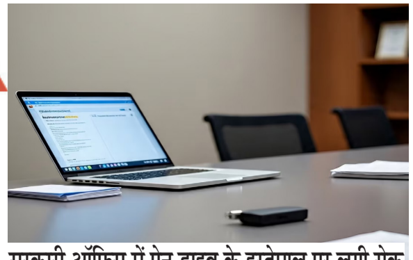
सरकारी ऑफिस में पेन ड्राइव के इस्तेमाल पर लगी रोक