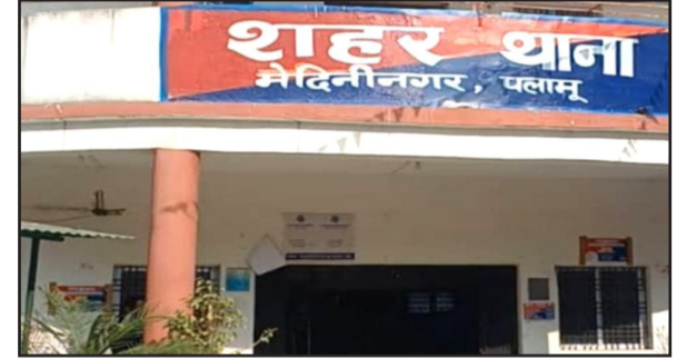
मेदिनीनगर में सेक्स रैकेट का भंडाफोड़।