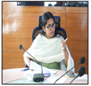
उपायुक्त समीरा एस ने किसानों को समय पर खाद-बीज उपलब्ध कराना सुनिश्चित करने का निर्देश दिया।

नवबिहार टाइम्स ब्यूरो मेदिनीनगर (पलामू)। उपायुक्त समीरा एस ने सोमवार को समाहरणालय सभागार में कृषि, गव्य, मत्स्य, उद्यान, सहकारिता, भू-संरक्षण और पशुपालन विभाग की विस्तृत समीक्षा की। इस दौरान उन्होंने अधिकारियों को स्पष्ट निर्देश दिया कि जिले के किसानों को समय पर और उचित दर पर खाद एवं बीज उपलब्ध कराना सुनिश्चित किया जाए। मत्स्य विभाग की समीक्षा में उपायुक्त ने लक्ष्य और उपलब्धि का तुलनात्मक आंकड़ा देखा। बताया कि मत्स्य बीज उत्पादकों को स्पष्ट निर्देश दिए जा चुके हैं। 370 मत्स्य पालकों को फीड और