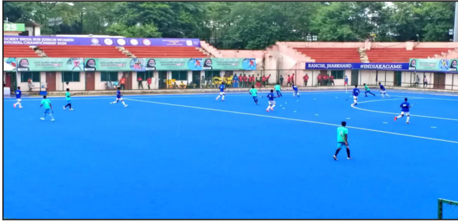
रांची में आयोजित हो रहे हैं राष्ट्रीय खेल दिवस के कार्यक्रम।

मजबूत करना चाहता है। झारखंड, जिसे लंबे समय से 'हॉकी की नर्सरी' कहा जाता है, इस बार आयोजन में अग्रणी भूमिका निभा रहा है। राज्य सरकार और खेल मंत्रालय के संयुक्त प्रयास से राजधानी रांची सहित राज्यभर में खेल और फिटनेस गतिविधियों का खाका तैयार कर लिया गया है। खेल विभाग, हॉकी झारखंड और विभिन्न खेल संगठनों की सक्रिय भागीदारी के साथ इस बार का आयोजन सिर्फ खिलाड़ियों तक सीमित न रहकर आम नागरिकों की भागीदारी सुनिश्चित करेगा। रांची बननेवाले का केंद्र राजधानी रांची के खेलांगण, बिरसा मुंडा हॉकी स्टेडियम और विभिन्न शैक्षणिक संस्थानों में फिटनेस कनिवल, योग शिविर, रन फॉर फिटनेस, वाद-विवाद प्रतियोगिता,