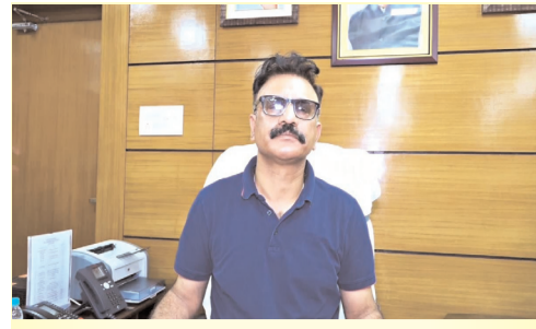
सूर्या एनकाउंटर मामला: सीआईडी ने शुरू की जांच