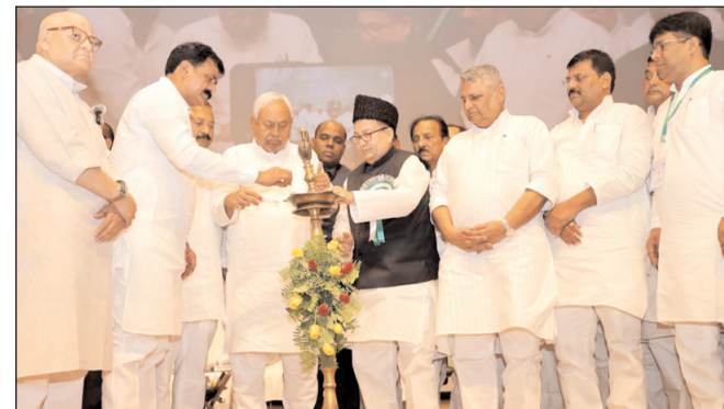
बिहार राज्य मदरसा शिक्षा बोर्ड के शताब्दी समारोह का उद्घाटन करते सीएम नीतीश कुमार

* मूल्य : 3.00 रुपये * औरंगाबाद एवं बोकारो से प्रकाशित * www.navbihartime.com