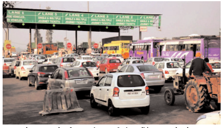
न्यायालय ने छह अगस्त को राष्ट्रीय राजमार्ग 544 के एडपल्लनी-मन्नुथी खंड की खराब स्थिति और निर्माण कार्यों के कारण लगने वाले यातायात जाम के आधार पर टोल शुल्क के निलंबन का आदेश

एसे ही एक मामले में सुप्रीम कोर्ट ने साफ कहा है कि अगर किसी व्यक्ति को पैसड किलोमीटर लंबे राजमार्ग को तय करने में बारह घंटे लगते हैं, तो उस यात्री को टोल शुल्क का भुगतान करने के लिए क्यों कहा जाए। यानी जिस दूरी को पार करने में तबकीबन एक घंटे का समय