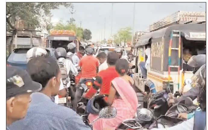
नवबिहार टाइम्स ब्यूरो

हजारीबाग। रांची-पटना नेशनल हाईवे पर बुधवार को टोल प्लाजा और सिरसी गांव के बीच सड़क हादसे में 12 घंटे के नवजात शिशु और उसकी मौसी की मौके पर मौत हो गई जबकि बच्चे के पिता गंभीर रूप से घायल हुए हैं। घायल को श्रेष्ठ भिखारी मेडिकल कॉलेज अस्पताल में भर्ती कराया गया है। बताया जाता है कि मृत बच्चे के पिता अपनी पत्नी की बहन और नवजात शिशु को इलाज के लिए अस्पताल ले जा रहे थे। इसी दौरान एक अनियंत्रित वाहन ने