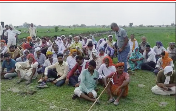
ग्रामीणों ने आरोप लगाया कि प्रशासन और निर्माण कंपनी मिलकर जबर्जती जमीन कब्जा कर रहे हैं। किसान नेताओं ने कहा कि अधिकारी किसानों के हितों की रक्षा करने के बजाय कंपनी के एजेंट की तरह बर्ताव कर रहे हैं। किसानों ने सरकार की नीतियों पर भी सवाल खड़े किए। उनका कहना है कि सरकार कॉर्पोरेट कंपनियों को लाभ पहुंचाने के लिए अग्रियों जैसी नीति पर चल रही है। डबल इंजन सरकार किसानों को जबर्जती जमीन से बेदखल कर रही है।

नवबिहार टाइम्स संवाददाता कैमूर। जिले से होकर गुजर रही भारतमाला परियोजना के तहत बनने वाले एक्सप्रेसवे की जमीन अधिग्रहण को लेकर मंगलवार को किसानों और प्रशासन के बीच विवाद गहरा गया। इस दौरान पुलिस ने चार किसानों को हिरासत में लिया, जिन्हें देर रात छोड़ दिया गया। बुधवार को भारतीय किसान यूनियन से जुड़े बड़ी संख्या में किसान चैनपुर प्रखंड के करवंदिया गांव पहुंचे। मौके पर किसी अग्रिय घटना से निपटने के लिए भारी पुलिस बल की तैनाती की गई है। किसानों ने आरोप लगाया कि कैमूर डीएम ने पहले ही निर्देश दिया था कि चिन्हित जमीन पर किसान फसल नहीं लगाएं। इसके जवाब में किसानों की मांग थी कि 10 जुलाई तक मुआवजा राशि का भुगतान कर दिया जाए, लेकिन अब तक किसी को भी मुआवजा नहीं मिला है। किसानों का आरोप है कि पुलिस बल की मौजूदगी में जेसीबी मशीन से खेतों में लगी खड़ी फसलें रौंद दी गईं।