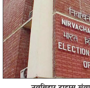
नवबिहार टाइम्स संवाददाता पटना। छह वर्षों से चुनाव में भाग नहीं लेने वाले दलों को डीलिट करने की प्रक्रिया शुरू कर दी गई है। इस क्रम में पटना जिलांतर्गत पांच दलों को चिह्नित किया गया है। इन्हें नोटिस का तामील कराने की प्रक्रिया शुरू कर दी गई है। जिन दलों को नोटिस तामील कराना है उनमें भारतीय युवा जनशक्ति पार्टी, एकता विकास महासभा पार्टी, गरीब जनता दल (सेकुलर), राष्ट्रीय सदाबहार पार्टी एवं योग इंडिया पार्टी शामिल है। दरअसल, भारत निर्वाचन आयोग ने वैसे पंजीकृत गैरमान्यता प्राप्त राजनीतिक दलों को डीलिट करने की कार्यवाही शुरू की है, जिन्होंने 2019 से अब तक किसी भी चुनाव में भाग नहीं लिया है। जिनके कार्यालय देशभर में कहीं भी भौतिक रूप से नहीं पाए गए हैं। आयोग ने संबंधित राजनीतिक दल से कारण-पृच्छ कर तथ्यात्मक प्रतिवेदन भेजने का निर्देश दिया है। इस आलोक में जिला निर्वाचन पदाधिकारी-सह-जिला पदाधिकारी ने पटना जिलांतर्गत पांच पंजीकृत गैरमान्यता प्राप्त राजनीतिक दलों को निर्वाचन विभाग से जारी नोटिस तथा भारत निर्वाचन आयोग के पत्र का विधिवत ढंग से तामिला कराने का निर्देश दिया है। साथ ही अधिकारियों को 24 घंटा के अंदर प्रतिवेदन देना है। सख्त निर्देशों के तामील नही होता है तो इस संबंध में संबंधित पदाधिकारी को स्पष्ट प्रतिवेदन देने का निर्देश दिया गया है। किसी भी राजनीतिक दल को अनुचित रूप से डीलिट नहीं किया जाए, इसके लेकर भारत निर्वाचन आयोग ने मुख्य निर्वाचन अधिकारी को ऐसे दलों को कारण बताओ नोटिस जारी करने का निर्देश दिया है। इसके बाद मुख्य निर्वाचन पदाधिकारी इन दलों को सुनवाई का अवसर देंगे। किसी भी ऐसे दल को डीलिट करने का अंतिम निर्णय भारत निर्वाचन आयोग ही लेगा।