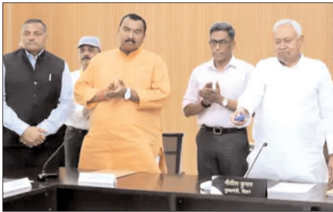
को अनुग्रहिक राहत राशि का भुगतान शुरू हो गया है। मुख्यमंत्री ने अधिकारियों को सतर्क रहने का निर्देश देते हुए कहा कि सितंबर माह में भी नदियों का

पटना। मुख्यमंत्री नीतीश कुमार ने बुधवार को 1 अणे मार्ग स्थित 'संकल्प' से बाढ़ प्रभावित परिवारों को डीबीटी के माध्यम से राहत राशि का भुगतान शुरू किया। इसके तहत 12 जिलों के 6 लाख 51 हजार 602 परिवारों को प्रति परिवार सात हजार रुपये की दर से कुल 456 करोड़ 12 लाख रुपये की राशि सीधे बैंक खातों में भेजी गई। मुख्यमंत्री ने कहा कि 13 अगस्त को बाढ़ प्रभावित जिलों की समीक्षा बैठक और 14 अगस्त को हवाई सर्वेक्षण किया गया था। अधिकारियों को राहत व बचाव कार्य युद्धस्तर पर करने का निर्देश दिया गया था। उन्होंने कहा कि आज तय समय सीमा के भीतर प्रभावित परिवारों