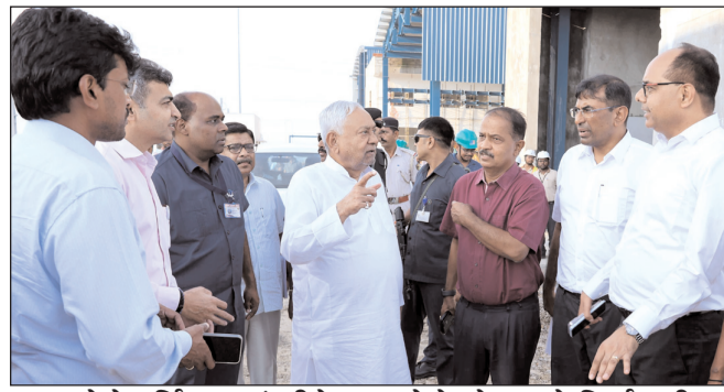
पटना मेट्रो टर्मिनल एवं जीरोमाइल मेट्रो स्टेशन के निर्माणधीन कार्यों का स्थल निरीक्षण करते मुख्यमंत्री नीतीश कुमार

* रजि. नंबर : 52290/90 * वर्ष : 36 * अंक : 84 * पृष्ठ : 12 * औरंगाबाद, बुधवार, 20 अगस्त 2025 * मूल्य : 3.00 रुपये * औरंगाबाद एवं बोकारो से प्रकाशित * www.navbihartime.com