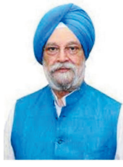
हरदीप एस पुरी