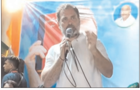
राहुल गांधी ने निर्वाचन आयोग पर साधा निशाना लगाया। उन्होंने कहा कि जिस तरह प्रधानमंत्री नरेन्द्र मोदी लगातार नए पैकेज की घोषणाएं करते हैं, उसी तर्ज पर बिहार में

गयाजी। मतदाता अधिकार यात्रा के तहत सोमवार को कांग्रेस नेता राहुल गांधी गया पहुंचे। जिले के विभिन्न इलाकों में कार्यकर्ताओं और समर्थकों ने उनका जोरदार स्वागत किया। औरंगाबाद से होते हुए वे डबुर गांव पहुंचे जहां उन्होंने सभा को संबोधित किया। इसके बाद अहियापुर, पंचानपुर, केवाली, कुजापी और नेपा सहित कई स्थानों पर जनसमूह ने उनका अभिनंदन किया। देर शाम वे गया शहर के गेवाल विंगहा स्थित खालिस पार्क पहुंचे और विशाल जनसभा को संबोधित किया। अपने संबोधन में