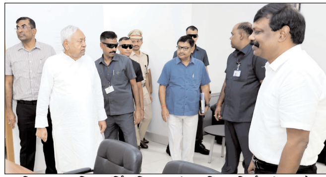
ललित नारायण मिश्र आर्थिक विकास एवं सामाजिक परिवर्तन संस्थान के विभिन्न भागों का निरीक्षण करते मुख्यमंत्री नीतीश कुमार