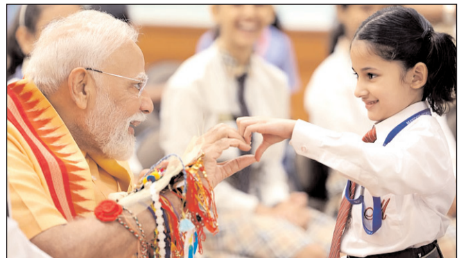
पीएम नरेन्द्र मोदी ने ब्रह्माकुमारी दीदी और छोटी-छोटी बहनों से बंधवाई राखी

* मूल्य : 3.00 रुपये * औरंगाबाद एवं बोकारो से प्रकाशित * www.navbihartime.com