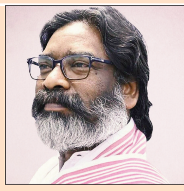
दिनचर्या का हिस्सा है। उन्होंने अधिकारियों को निर्देश दिए हैं कि वे कार्यों में तत्परता बनाए रखें और आम जनता की समस्याओं का त्वरित समाधान करें। किसी भी कार्य में लापरवाही बर्दाश्त नहीं की जाएगी। साथ ही, वे हर पल अद्यतन सूचनाओं से अवगत रहते हैं और आवश्यकतानुसार निर्देश देते हैं। मुख्यमंत्री ने कहा कि शिबू सोरेन के निधन के बाद जनता का अपार समर्थन उनके परिवार के लिए

नवबिहार टाइम्स संवाददाता रांची। मुख्यमंत्री हेमंत सोरेन अपने जीवन के सबसे कठिन दौर से गुजर रहे हैं। उनके पिता दिशोम गुरु शिबू सोरेन के निधन ने उन्हें गहरे शोक में डुबो दिया है। फिर भी, व्यक्तिगत दुख को दरकिनार कर वे रामगढ़ के नेमरा स्थित अपने पैतृक आवास से राजधर्म का निर्वहन कर रहे हैं। यह उनके दृढ़ संकल्प और जिम्मेदारी के प्रति समर्पण को दर्शाता है। मुख्यमंत्री के लिए यह समय अत्यंत दुखदायी है। उनके दिल-दिमाग में बेचैनी और पीड़ा है, आंसूओं का सिलसिला थम नहीं रहा। इसके बावजूद वे पुत्रधर्म के साथ-साथ राजधर्म को भी पूरी निष्ठा से निभा रहे हैं। नेमरा में पारंपरिक रीति-रिवाजों का पालन करते हुए वे शासन-प्रशासन को सुचारू रूप से चलाने में जुटे हैं। उनका यह प्रयास सुनिश्चित करता है कि झारखंड के विकास की गति में कोई रुकावट न आए। मुख्यमंत्री शोक की इस घड़ी में भी राज्य के हितों के प्रति पूरी तरह संवेदनशील हैं। वे व्यक्तिगत भावनाओं को दबाकर सरकारी कार्यों को प्राथमिकता दे रहे हैं। जरूरी फाइलों का निष्पादन, वरिष्ठ अधिकारियों के साथ नियमित संवाद और सरकार की गतिविधियों पर नजर रखना उनकी