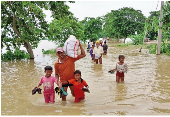
नवबिहार टाइम्स संवाददाता

पटना। जिले में गंगा और सोन नदी के जलस्तर में लगातार वृद्धि के कारण दानापुर दिवारा के निचले हिस्से में बाढ़ का पानी तेजी से फैल गया है। इस बाढ़ ने छह पंचायतों को पूरी तरह अपनी चपेट में ले लिया है। निचले इलाकों के घरों में पानी घुसने से लोग घर छोड़कर शहर की ओर पलायन करने को मजबूर हैं। इन पंचायतों का शहर मुख्यालय से संपर्क पूरी तरह टूट चुका है और नाव ही अब लोगों की एकमात्र जीवन रेखा बन गई है। जानकारी के अनुसार, दानापुर दिवारा के पानापुर, मानस, पुरानी पानापुर, हेतनपुर, पतलापुर समेत कई गांव बुरी तरह प्रभावित हैं। खेतों में लगी पूरी फसल डूब चुकी है। बाढ़ के पानी के कारण सबसे बड़ी समस्या पीने के शुद्ध पानी, भोजन और मवेशियों के चारे की हो गई है। ग्रामीण उर-सहमे हालात का सामना कर रहे हैं और सुरक्षित स्थानों की ओर पलायन कर रहे हैं। कई परिवार दानापुर शहर में बने बाढ़ राहत कैंपों में भी पहुंचने लगे हैं ताकि अपनी और अपने बच्चों की जान बचा सकें।