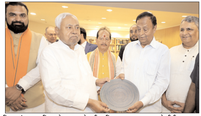
बिहार संग्रहालय बिनाले-2025 के प्रतीक चिह्न का अनावरण करते नीतीश कुमार

* मूल्य : 3.00 रुपये * औरंगाबाद एवं बोकारो से प्रकाशित * www.navbihartime.com