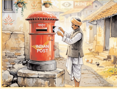
की खुशबू ही इन्होंने छीन ली। पत्र के लिए जो बेसब्री रहती थी, वह भी अब समाप्त हो गया। सूचना क्रांति और इंटरनेट के दौर में लोग अब सतत निगरानी प्रणाली

रजिस्टर्ड पोस्ट-तुमने हमें जोड़ा, शहर से गांव, मां से बेटे, दोस्त से दोस्त। तुमने रिश्तों को दूरी से आजाद किया। अब तुम नहीं रहोगी लेकिन हमारी यादों में हमेशा रहोगी। आगे तुम्हारा स्थान लेने के लिए तुमसे ज्यादा विश्वसनीय और भरोसेमंद अब स्पीड पोस्ट हमारे साथ होगा। तेज, ट्रैक करने योग्य, और आधुनिक। लेकिन वो गर्मजोशी, वो अपनापन जो तुममें था (पुराने डाक में) वो शायद फिर कभी वापस न आए। अलविदा रजिस्ट्री, तुम हमारे दिल में, धड़कनों में सदा रहोगे।