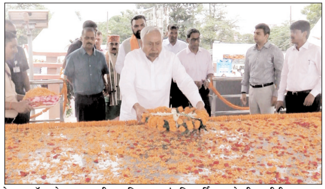
देशरत्न डॉ. राजेन्द्र प्रसाद की समाधि पर श्रद्धांजलि अर्पित करते सीएम नीतीश कुमार

* मूल्य : 3.00 रुपये * औरंगाबाद एवं बोकारो से प्रकाशित * www.navbihartime.com