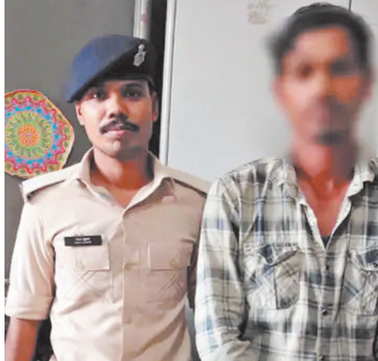
किशनगंज, एजेंसी। किशनगंज के कोचाधामन थाना क्षेत्र में हुए रेप मामले में पुलिस ने मात्र 24 घंटे के

आंगनवाड़ी केंद्र में घटना को दिया था अंजाम, फरार आरोपी की तलाश जारी