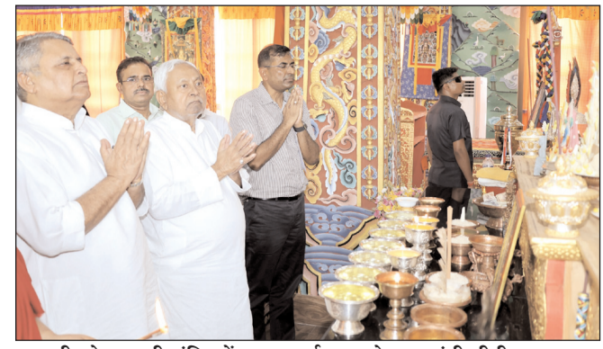
राजगीर के भूटानी मंदिर में पूजा-अर्चना करते मुख्यमंत्री नीतीश कुमार

* मूल्य : 3.00 रुपये * औरंगाबाद एवं बोकारो से प्रकाशित * www.navbihartime.com