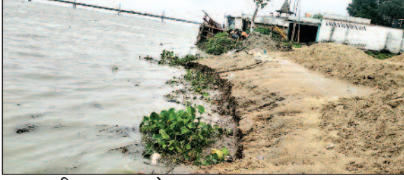
नवबिहार टाइम्स ब्यूरो

छपरा/डोरीगंज (सारण)। गंगा, सरजू (बाघरा) और सोन—सारण की तीनों प्रमुख नदियों के जलस्तर में लगातार बढ़तीरी से जिले में बाढ़ की स्थिति गंभीर होती जा रही है। छपरा से सोनपुर तक गंगा नदी खतरों के निशान से ऊपर बह रही है, जिससे सदर प्रखंड के दियारा व तटीय इलाकों में जनजीवन अस्त-व्यस्त हो गया है। सदर प्रखंड के रायपुर बिंदगांव,