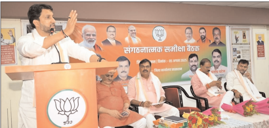
अपने-अपने बीएलओ के पास जमा करने का प्रयास करेंगे। इसके साथ ही 'हर घर तिरंगा, घर-घर तिरंगा' अभियान को सफल बनाने के लिए कार्यकर्ता आम जनमानस को प्रेरित कर राष्ट्रभक्ति की भावना को और