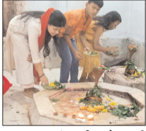
बहादुरपुर, अंधवारी समेत कई शिवालयों में भगवान शिव जी की पूजा-अर्चना को लेकर श्रद्धालुओं की काफी भीड़ देखी गई। सावन महीने की अंतिम सोमवारी पर सुबह से ही प्रखंड क्षेत्र के महिला-पुरुष श्रद्धालुओं में काफी उत्साह व खुशी देखने को मिल रहा था। श्रद्धालुओं ने अहले सुबह से ही स्नान-स्नान कर नए-नए वस्त्र धारण कर अपने-अपने क्षेत्र के अपने-अपने मंदिरों व शिवालयों में

नवबिहार टाइम्स संवाददाता रजौली। श्रावण मास की चौथी एवं अंतिम सोमवारी पर रजौली प्रखंड क्षेत्र के सभी शिव मंदिर शिवमय नजर आएंगे। शिव मंदिरों में अंतिम सोमवारी पर सैकड़ों श्रद्धालु पूजा-अर्चना की। मंदिरों में काफी भीड़ देखने को मिली। हर हर महादेव, जय शिव शंभु व बोल बम से प्रखंड क्षेत्र के सभी शिवालय गूंज उठा। बाजार मुख्यालय के देवी मंदिर स्थित शिवालय, महसईं स्थित मसेश्वरी नाथ मंदिर, नीचे बाजार स्थित राज शिव मंदिर, पुरानी बस स्टैंड स्थित महावीर मंदिर, झंझा चौक की ओर सहाय भवन मंदिर के साथ प्रखंड के हरदिया, चितरकोली, घसियाडीह, दत्तीटांका, सरसमपुर गांव स्थित लोमस ऋषि पहाड़ पर शिव मंदिर, कुहठरा, धमनी, करिगांव,