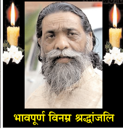
भावपूर्ण विनम्र श्रद्धांजलि

पार्टी कार्यालय में अंतिम दर्शन के लिए रखा जाएगा। इसके बाद पार्थिव शरीर को झारखंड विधानसभा ले जाया जाएगा जहां जनप्रतिनिधि और अधिकारी उन्हें श्रद्धांजलि अर्पित करेंगे। अंतिम संस्कार उनके पैतृक गांव रामगढ़ जिले के नेमरा में मंगलवार को किया जाएगा। इसमें कांग्रेस अध्यक्ष मल्लिकार्जुन खड़गे और राहुल गांधी शामिल होंगे। शिबू