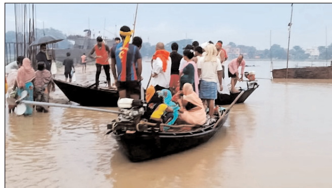
पटना के कई इलाकों में पानी घुसने से लोग नाव से चलने पर मजबूर हैं

* रजि. नंबर : 52290/90 * वर्ष : 36 * अंक : 70 * पृष्ठ : 12 * औरंगाबाद, मंगलवार, 5 अगस्त 2025 * मूल्य : 3.00 रुपये * औरंगाबाद एवं बोकारो से प्रकाशित * www.navbihartime.com