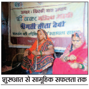
शुरूआत से सामूहिक सफलता तक