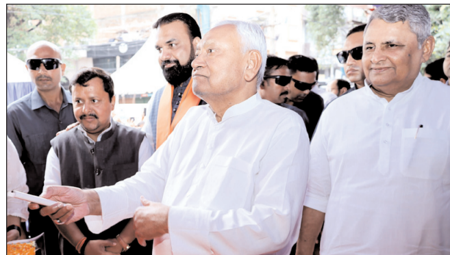
पटना में कुर्जी नाला निर्माण योजना का शिलान्यास करते मुख्यमंत्री नीतीश कुमार

* रजि. नंबर : 52290/90 * वर्ष : 36 * अंक : 68 * पृष्ठ : 12 * औरंगाबाद, रविवार, 3 अगस्त 2025 * मूल्य : 3.00 रुपये * औरंगाबाद एवं बोकारो से प्रकाशित * www.navbihartime.com