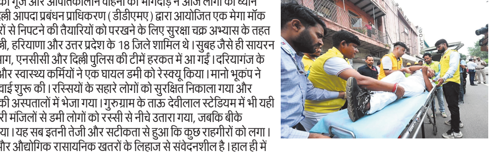
डिल्ली-एनसीआर में सायरनों की गुंज और आपातकालीन वाहनों की भागदौड़ ने आज लोगों का ध्यान खींचा। यह कोई असली आपदा नहीं थी, बल्कि दिल्ली आपदा प्रबंधन प्राधिकरण (डीडीएमए) द्वारा आयोजित एक मेगा मॉक ड्रिल थी। भूकंप और औद्योगिक रासायनिक खतरों से निपटने की तैयारियों को परखने के लिए सुरक्षा चक्र अभ्यास के तहत 55 से अधिक स्थानों पर यह ड्रिल हुई, जिसमें दिल्ली, हरियाणा और उत्तर प्रदेश के 18 जिले शामिल थे। सुबह जैसे ही सायरन बजे, एनडीआरएफ, एसडीआरएफ, स्वास्थ्य विभाग, एनसीसी और दिल्ली पुलिस की टीमें हरकत में आ गईं। दरियागंज के गोलाघाट सिनेमा में मॉक ड्रिल हुई, जहां डीडीएमए और स्वास्थ्य कर्मियों ने एक घायल डमी को रेस्क्यू किया। मानो भूकंप ने इमारत को हिला दिया हो, बचाव दल ने तुरंत कार्रवाई शुरू की। रस्सियों के सहारे लोगों को सुरक्षित निकाला गया और प्राथमिक उपचार के बाद गंभीर घायलों को नजदीकी अस्पतालों में भेजा गया। गुरुग्राम के ताऊ देवीलाल स्टेडियम में भी यही जोश दिखा। सेक्टर 31 के पॉल क्लीनिक में ऊपरी मंजिलों से डमी लोगों को रस्सी से नीचे उतारा गया, जबकि बीके अस्पताल में घायल डमियों को तुरंत भर्ती किया गया। यह सब इतनी तेजी और सटीकता से हुआ कि कुछ राहगीरों को लगा। डीडीएमए के अनुसार, दिल्ली-एनसीआर भूकंप और औद्योगिक रासायनिक खतरों के लिहाज से संवेदनशील है। हाल ही में मानसून के दौरान आर्द्र हल्के भूकंपीय झटकों ने इस खतरों को और रेखांकित किया है। इस ड्रिल का मकसद आपदा के दौरान अंतर-एजेंसी समन्वय, त्वरित प्रतिक्रिया और आम लोगों की सुरक्षा सुनिश्चित करना था। अधिकारियों ने बताया, यह अभ्यास हमें अपनी कमियों को पहचानने और उन्हें सुधारने का मौका देता है। अगर असली आपदा आई, तो हमारी टीमें तैयार रहेंगी। इस ड्रिल में सशस्त्र बल, एनजीओ, बाजार संघ और स्थानीय प्रशासन ने भी हिस्सा लिया, जिससे यह एनसीआर का पहला एकीकृत आपदा प्रबंधन अभ्यास बना।