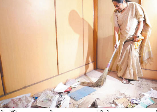
इलेक्ट्रॉनिक कबाड़ को हटाय। पुराने पोस्टर और बेकार पड़े फाइल को निकाला। फिर उन्होंने एक झाड़ू हाथ में ली और कमरे को साफ करने लगीं। मुख्यमंत्री ने कहा कि इस इमारत में 2021 में आग लगी थी, लेकिन अभी तक कोई मरम्मत नहीं कराई गई। पिछली आप सरकार और पूर्व मुख्यमंत्री अरविंद केजरीवाल पर निशाना साधते हुए रेखा गुप्ता ने कहा, उन्होंने करोड़ों रुपये शीशमहल पर खर्च किए लेकिन सरकारी दफ्तरों की हालत सुधारने के लिए कुछ नहीं किया।

नई दिल्ली, एजेंसी। दिल्ली की मुख्यमंत्री रेखा गुप्ता ने शुक्रवार को खुद झाड़ू उठाकर एक सरकारी दफ्तर में साफ-सफाई की। उनकी सरकार ने दिल्ली को कूड़े से आजादी नाम के एक अभियान की शुरुआत की है और एक महीने में तस्वीर बदलने का लक्ष्य रखा है। अभियान की शुरुआत करने के लिए मुख्यमंत्री दिल्ली सरकार के महिला एवं बाल विकास विभाग के कार्यालय में पहुंचीं और इसकी हालत देखकर बेहद दुखी हो गईं। दफ्तर के एक हिस्से में झाड़ू लगाते हुए उन्होंने यह भी पूछा कि क्या छह महीने सालभर में भी सफाई नहीं होती? कश्मीरी गेट स्थित कार्यालय की हालत देखकर मुख्यमंत्री बेहद दुखी हुईं और आम आदमी पार्टी की सरकार को कोसा। उन्होंने कहा, मैं इस दफ्तर में पहली बार आई हूँ। यह देखकर दुख हो रहा है कि हमारे अधिकारी ऐसी इमारत में काम कर रहे हैं। पंखा कभी भी गिर सकता है। छत टपक रही है। मुख्यमंत्री दफ्तर के हर कोने में गईं। पुराने