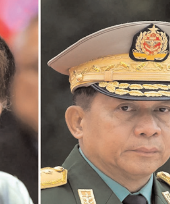
साल से भी अधिक समय बाद हुई है। तख्तापलट के बाद होगा पहला चुनाव: 2021 में हुए तख्तापलट के बाद यह पहला चुनाव होगा। तख्तापलट ने

म्यांमार को गृहयुद्ध और अराजकता में धकेल दिया है। इस वजह से संदेह पैदा हो रहा है कि क्या विश्वसनीय मतदान हो पाएगा। बहरहाल, म्यांमार के अधिकारियों ने भी घोषणा की है कि चुनाव दिस्तंबर 2025 में होंगे, हालांकि, इसके लिए सटीक तारीख अभी तय नहीं हुई है। इस बीच, वरिष्ठ जनरल मिन आंग हलेंग ने अब भंग हो चुकी राज्य प्रशासन परिषद के प्रमुख और प्रधानमंत्री पद से इस्तीफा दे दिया है। हालांकि, अब वे एक नई व्यवस्था के तहत व्यापक शक्तियों के साथ कार्यवाहक राष्ट्रपति बन गए हैं, जिससे उनका प्रमुख राजनीतिक प्रभाव बरकरार रहेगा। राष्ट्रीय स्वामित्व वाली म्यांमार रेडियो और टेलिविजन की रिपोर्ट के अनुसार अब यू न्यो साव संघीय सरकार में प्रधानमंत्री होंगे और वरिष्ठ