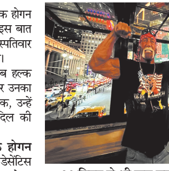
90 मिनट से भी कम समय में अस्पताल में मृत घोषित किया: पुलिस के मुताबिक, 24 जुलाई की सुबह जब उन्हें दिल का दौरा पड़ा, तो डॉक्टर क्लियरवॉटर स्थित उनके घर पहुंचे। लेकिन 90 मिनट से भी कम समय में उन्हें अस्पताल में मृत घोषित कर दिया गया।

प्लोरिडा, एजेंसी। महान अमेरिकी रेसलर हल्क होगन की पिछले सप्ताह हार्टअटैक से ही मौत हुई थी। इस बात की पुष्टि प्लोरिडा के मेडिकल परीक्षक की बृहस्पतिवार (स्थानीय समयानुसार) को जारी रिपोर्ट में हुई है। मेडिकल परीक्षक की रिपोर्ट के अनुसार, जब हल्क होगन की मौत हुई, तब वह 71 साल के थे और उनका असली नाम टैरी बोलिया था। रिपोर्ट के मुताबिक, उन्हें पहले से ही ब्लड कैन्सर (ल्यूकेमिया) और दिल की धड़कन की बीमारी (एट्रियल फिब्रिलेशन) थी। गवर्नर ने सम्मान में शुक्रवार को हल्क होगन दिवस घोषित किया: प्लोरिडा के गवर्नर रॉन डेसैंटिस ने उन्हें सम्मान देने के लिए शुक्रवार को हल्क होगन दिवस घोषित किया है। इस दिन प्लोरिडा के सभी सरकारी भवनों पर झंडे आधे झुकाए जाएंगे। रिपब्लिकन गवर्नर ने कहा कि हल्क होगन एक सच्चे प्लोरिडावासी थे।