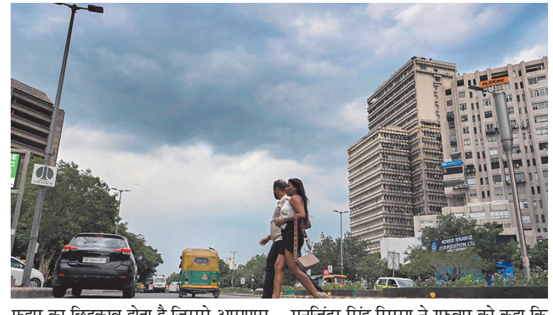
फुहार का छिड़काव होता है जिससे आसपास की हवा ठंडी होती है और इसमें मौजूद धूलकण दब जाते हैं। इससे तापमान में सुधार होता है और बेहतर वायु गुणवत्ता बेहतर होती है। वार्ता के अनुसार, दिल्ली के पर्यावरण मंत्री

सिरसा ने कहा हमने प्रदूषण को नियंत्रित करने के लिए सभी जरूरी कदम उठाए हैं। मुख्यमंत्री रेखा गुप्ता के नेतृत्व में हमारी टीम 24x7 जमीन पर काम कर रही है। वन महोत्सव से हरियाली बढ़ाने, धूल नियंत्रण, ऑटोमेटिक मिस्टिंग, मैकेनाइज्ड रोड स्वीपिंग और कचरे के पहाड़ हटाने के लिए बायो-माइनिंग तक, हर कदम असरदार परिणाम दे रहा है। उन्होंने कहा कि यह सुधार केवल मौसम का अंतर नहीं, बल्कि तकनीक आधारित योजनाओं को लागू करने का नतीजा है। पर्यावरण मंत्री ने कहा दिल्ली की साफ हवा इस जुलाई में कोई संयोग नहीं; यह नीति, प्रवर्तन और टीमवर्क का परिणाम है। हमने ऐसे सिस्टम बनाए हैं, जो पूरे साल काम करते हैं, जिससे यह प्रगति टिकाऊ बनी रहेगी। उन्होंने कहा कि जुलाई में 31 में से 29 दिन 'गुड' या 'संतोषजनक' श्रेणी में वायु गुणवत्ता दर्ज हुई।