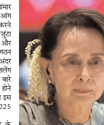
लोकतांत्रिक व्यवस्था के प्रति अपनी प्रतिबद्धता दोहराई। यह घोषणा फरवरी 2021 में आंग सान सू की की निर्वाचित सरकार से सेना द्वारा सत्ता हथियाने के तीन

चांगून, एजेंसी। पूर्वी पड़ोसी देश म्यांमार के सैन्य शासक वरिष्ठ जनरल मिन आंग हलेंग ने देश में आपातकाल खत्म करने की घोषणा की है। इसके साथ ही जुंटा शासन ने वहां नयी संघीय सरकार और राज्य सुरक्षा एवं शांति आयोग का गठन किया है। ताकि अगले छह महीने के अंदर चुनाव कराया जा सके। सैन्य शासक,हलेंग ने गुरुवार (स्थानीय समय) को इस बारे में घोषणा की कि अक्टूबर 2024 में होने वाली राष्ट्रव्यापी जनगणना पूरी होते ही इस साल के अंत तक यानी दिसंबर 2025 तक राष्ट्रीय चुनाव होंगे। जुंटा शासन की तीसरी वर्षगांठ के अवसर पर एक टेलीविजन संबोधन में मिन आंग हलेंग ने कहा कि मतदान जनगणना पूरी होने के बाद होगा। इसके साथ ही उन्होंने देश में बहुदलीय