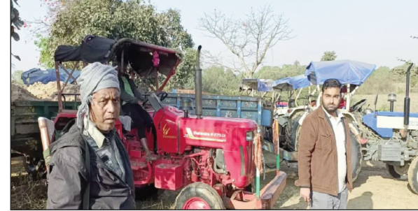
किसी को इसका पता न लगे। बालू के अवैध खनन की वजह से इन मामलों में ट्रैक्टरों की आवाजाही बनी रहती है, इससे सड़क पर आते-जाते लोगों को काफी परेशानी उठानी पड़ती है। इस सड़क से प्रतिदिन छात्र छात्राओं का भी स्कूल आना जाना होता है, जिससे खतरे की आशंका बनी रहती है। आइए थाना पुलिस ने अवैध बालू लदे दो ट्रैक्टर को जब्त किया। हेसला गांव के पास सड़क पर पुलिस ने बालू लदे ट्रैक्टर को रोकने का संकेत दिया तो दोनों ट्रैक्टर के चालक ट्रैक्टर को छोड़कर भाग गए। पुलिस ने दोनों ट्रैक्टरों को जब्त करके ट्रैक्टर चालक एवं मालिक के खिलाफ मामला दर्ज किया है। इस मामले में जांच की जा रही है। पुलिस द्वारा प्रयास करने के बाद भी बालू तस्करी की घटनाओं में लगातार इजाफा हो रहा है।

जाता है। बता दें कि जयनगर प्रखंड के विभिन्न बालू घाटों से प्रतिदिन अवैध बालू का खनन और परिवहन किया जा रहा है, जिससे सरकार को राजस्व की भारी क्षति हो रही है। वहीं, आम लोगों को भी काफी ऊंचे दामों में बिचौलियों द्वारा बालू बेचा जा रहा है, जिससे अबुआ आवास बनाने वाले लाभुकों को काफी परेशानी उठानी पड़ रही है। प्रखंड के करियावा, तमाय तथा लतबेवावा घाट से भी प्रतिदिन दर्जनों की संख्या में ट्रैक्टर से अवैध बालू परिवहन कर झुमरी तिलैया के विभिन्न स्थानों में अधिक दामों में बालू बेची जाती है। जयनगर प्रखंड मुख्यालय के समीप परिवहन कर झुमरी तिलैया के विभिन्न स्थानों में अधिक दामों में बालू बेची जाती है। जयनगर प्रखंड मुख्यालय के समीप परिवहन कर झुमरी तिलैया के विभिन्न स्थानों में अधिक दामों में बालू बेची जाती है। जयनगर प्रखंड मुख्यालय के समीप परिवहन कर झुमरी तिलैया के विभिन्न स्थानों में अधिक दामों में बालू बेची जाती है।