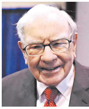
एनिमेटेड सीरीज बनाने में मदद की। इसका उद्देश्य बच्चों को व्यवसाय,

साल 2011 में बफे ने सीक्रेट मिलिनेयर्स क्लब नामक एक