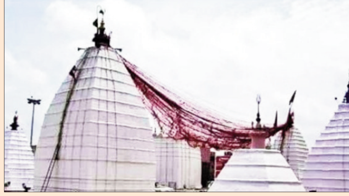
परंपरा सदियों से चली आ रही है। बाबा मंदिर प्रांगण स्थित राधा कृष्ण मंदिर से 13 मार्च को शाम चार बजे डोली निकाली जाएगी। जिस पर

गई। आसपास में घने जंगल निर्जन स्थल होने के कारण कोई नहीं दिखाई पड़ रहा था। उसी समय भगवान विष्णु चरवाहे के रूप में प्रकट हुए। रावण ने उन्हें देखकर आत्म लिंग पकड़ने के लिए कहा। इस पर भगवान विष्णु ने कहा कि महाराज यह तो बहुत भारी है मैं ज्यादा देर तक पकड़ कर नहीं रह सकता हूँ, इसलिए जल्दी आ जाइएगा। रावण के बहुत देर तक लघु शंका में रहने के कारण भगवान विष्णु अपनी माया से वहां से निकलकर माता सती का जहां पर हृदय गिरा था, वहां पर बाबा बैद्यनाथ को स्थापित कर दिया। वह दिन फागुन पूर्णिमा का दिन था। तभी से बाबाधाम ने हरि और हर का मिलन की परंपरा चली आ रही है। देवघर के लोग इस दिन को बाबा बैद्यनाथ की स्थापना दिवस के रूप में भी धूमधाम से मनाते हैं। इस बार 13 मार्च को हरिहर मिलन रात्रि 11:30 बजे होगा। इससे पूर्व रात 10:50 बजे पर होलिका दहन का शुभ मुहूर्त है। बाबा धाम में यह