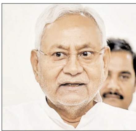
आठ हजार रुपये से दोगुना करते हुए अब 16 हजार रुपये करने का निर्णय लिया गया है। साथ ही इनकी वार्षिक वेतन वृद्धि 200 रुपये के स्थान पर 400 रुपये

नवबिहार टाइम्स ब्यूरो पटना। बिहार चुनाव से पहले मुख्यमंत्री नीतीश कुमार ने बिहारवासियों को एक और बड़ी सौगात दी है। उन्होंने मध्याह्न भोजन योजना में कार्यरत रसोइयों, रात्रि प्रहरी और फिजिकल ट्रेनरों के मानदेय को दोगुना कर दिया है। अब कैबिनेट की बैठक में इस पर मुहर भी लगा दी जाएगी। सीएम नीतीश कुमार ने इसकी घोषणा शुक्रवार सुबह सोशल मीडिया पर की। सीएम नीतीश कुमार ने लिखा कि शिक्षा विभाग के अंतर्गत मध्याह्न भोजन में कार्यरत रसोइयों के मानदेय में दोगुनी वृद्धि करते हुए 1650 रुपये से 3300 रुपये करने का निर्णय लिया गया है। सीएम नीतीश कुमार ने आगे लिखा कि माध्यमिक या उच्च शिक्षा विद्यालय में कार्यरत रात्रि प्रहरी का मानदेय 5000 रुपये से दोगुना करते हुए इसे अब 10000 रुपये करने का निर्णय लिया गया है। साथ ही शारीरिक शिक्षा एवं स्वास्थ्य अनुसंधानों का मानदेय