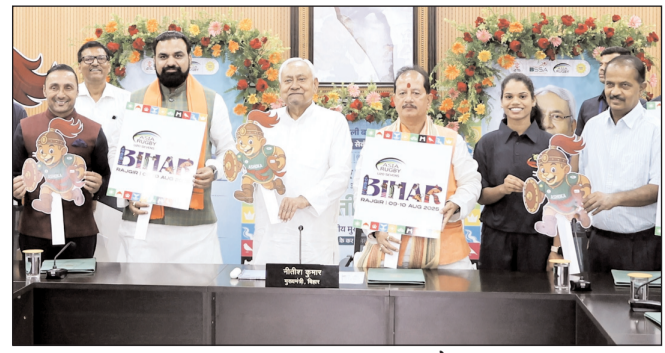
राजगीर में आयोजित होनेवाली एशिया रम्बी चैंपियनशिप के शुभंकर एवं लोगों का अनावरण करते मुख्यमंत्री नीतीश कुमार।

* रजि. नंबर : 52290/90 * वर्ष : 36 * अंक : 67 * पृष्ठ : 12 * औरंगाबाद, शनिवार, 2 अगस्त 2025 * मूल्य : 3.00 रुपये * औरंगाबाद एवं बोकारो से प्रकाशित * www.navbihartime.com