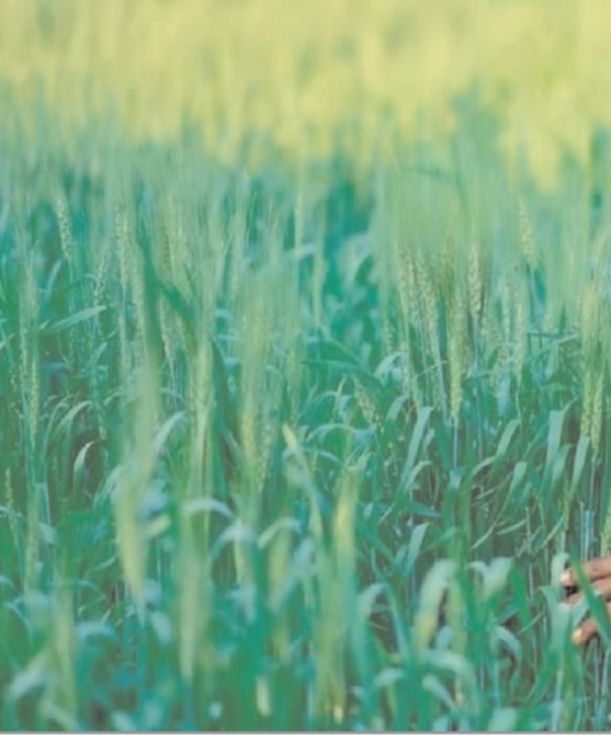
एक किसान पीएम किसान योजना के तहत अपने बैंक खाते में सहायता प्राप्त कर रहा है।

पहुंचने वाले शासन के एक बेहतरीन मॉडल के रूप में कार्य करता है। इसने विभिन्न भौगोलिक क्षेत्रों में भूमि अभिलेखों, लाभार्थियों के डेटाबेस और भुगतान प्रणालियों को सफलतापूर्वक समन्वित किया है और इससे दुनिया के किसी भी अन्य देश की तुलना में किसान-केंद्रित एक उत्तम संरचना का निर्माण हुआ है। पीएम किसान ने कृषि से जुड़े इकोसिस्टम में किसान ई-मित्र वॉयस-आधारित चैटबॉट और एग्री स्ट्रेक जैसी नवीन परियोजनाओं को भी प्रेरित किया है। एग्रीस्ट्रेक व्यक्तिगत, समय पर और पारदर्शी सेवाएं प्रदान करने के लिए तैयार है, जिससे भारतीय कृषि भविष्य की जरूरतों के अनुरूप तैयार हो सके।