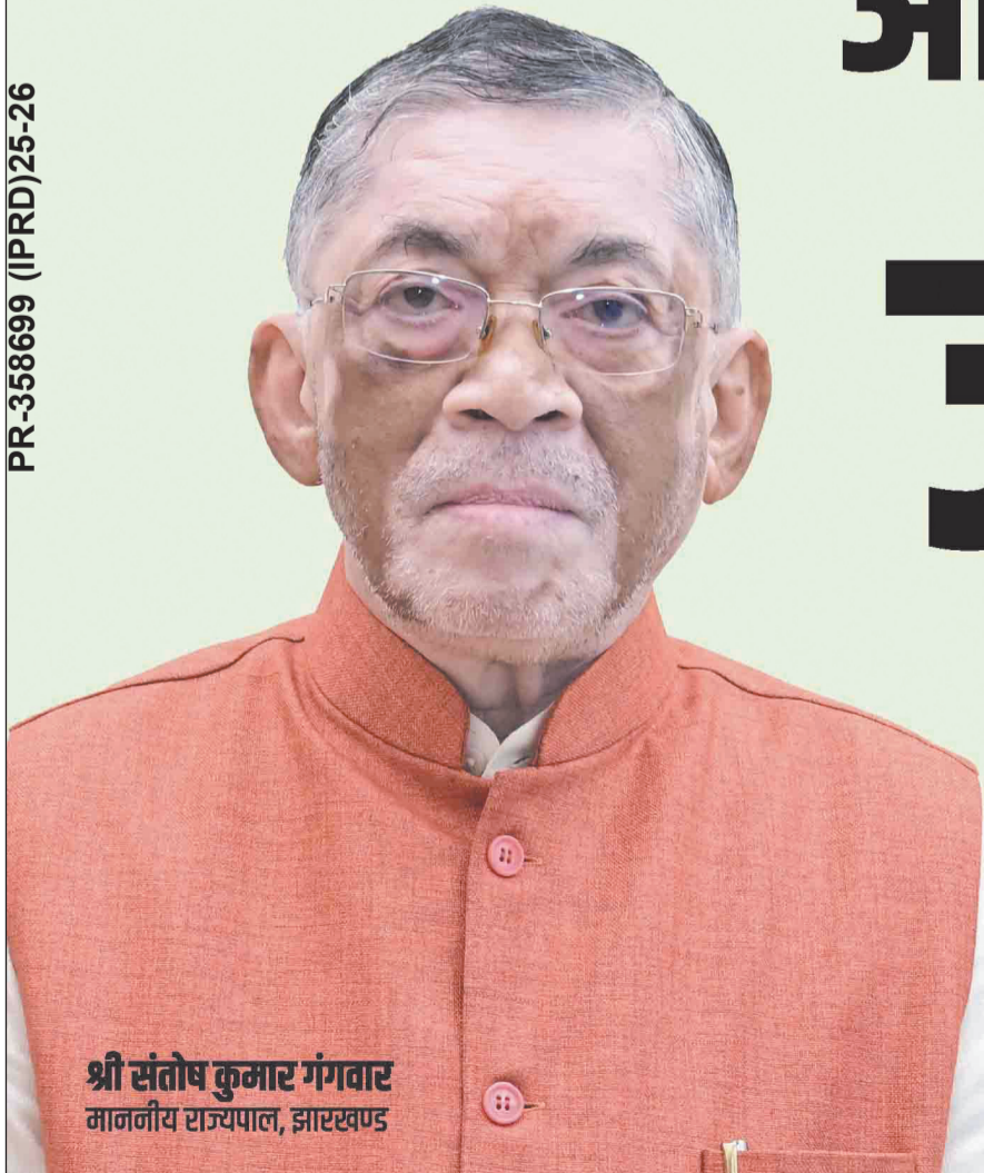
श्री संतोष कुमार गंगवार माननीय राज्यपाल, झारखण्ड