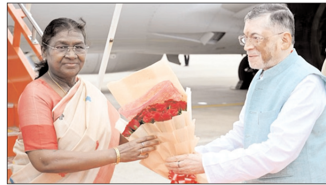
देवघर एयरपोर्ट पर राष्ट्रपति द्रौपदी मुर्मू का स्वागत करते राज्यपाल संतोष कुमार गंगवार

* मूल्य : 3.00 रुपये * औरंगाबाद एवं बोकारो से प्रकाशित * www.navbihartime.com