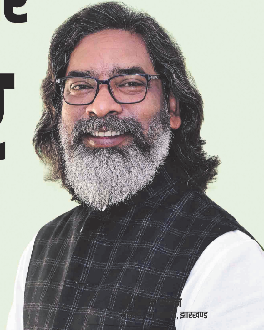
श्री संतोष कुमार गंगवार माननीय राज्यपाल, झारखण्ड