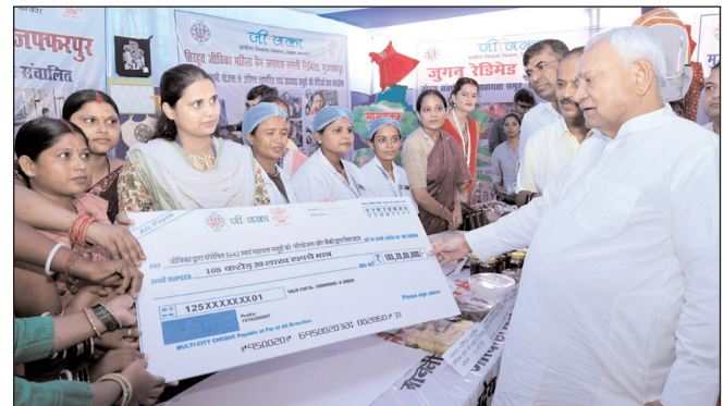
मुजफ्फरपुर में जीविका समूह को 105.39 करोड़ का चेक देते सीएम नीतीश कुमार

* रजि. नंबर : 52290/90 * वर्ष : 36 * अंक : 66 * पृष्ठ : 12 * औरंगाबाद, शुक्रवार, 1 अगस्त 2025 * मूल्य : 3.00 रुपये * औरंगाबाद एवं बोकारो से प्रकाशित * www.navbihartime.com