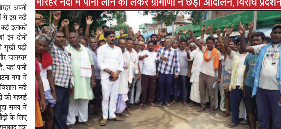
मोरहर नदी में पानी लाने को लेकर ग्रामीणों ने छेड़ा आंदोलन, विरोध प्रदर्शन

मसौढ़ी/नवबिहार टाइम्स संवाददाता। अखिल धारा के रूप में बिहार की विशाल नदी मोरहर अपनी अस्तित्व खोती जा रही है। पिछले 10 वर्षों से इस नदी में पानी तक नहीं आ रहा है। वहीं बिहार में कई इलाकों में बाढ़ से हालात खराब हैं। सभी नदियां इन दोनों उफाने पर हैं। वहीं मसौढ़ी के मोरहर नदी सूखी पड़ी हुई है। खेतों में पटवन नहीं हो रही है और जलस्तर गिरने से आसपास के चापाकल सूख गये हैं। यहां पानी की समस्या हो गई है। गंगा से निकलकर पटना गंगा में मिलने वाली मोरहर नदी कभी गहरी और विशाल नदी के रूप में जानी जाती थी। शुरूआत में नदी की गहराई लगभग सात-आठ मीटर थी, लेकिन मौजूदा समय में नदी पूरी तरह सूख गई है। मोरहर नदी मसौढ़ी के लिए जीवनदायिनी मानी जाती है। मोरहर नदी जहानाबाद तक आई जरूर है लेकिन उसे कई जगहों पर बीच बीच बनाकर उसे रोक दिया गया है। जिस वजह से मसौढ़ी में पानी नहीं आ रहा है। इसको लेकर न केवल प्रशासन के लिए किसान परेशान है बल्कि आसपास के गांव के लोगों का जलस्तर भी नीचे चले जाने से चापाकल सूख गए हैं। इसको लेकर अब स्थानीय गांव के लोगों ने