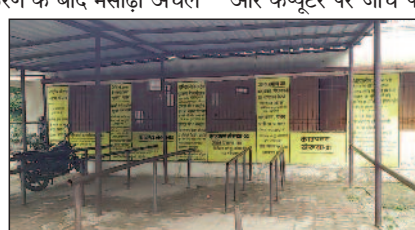
मसौढ़ी अंचल का आरटीपीएस काउंटर