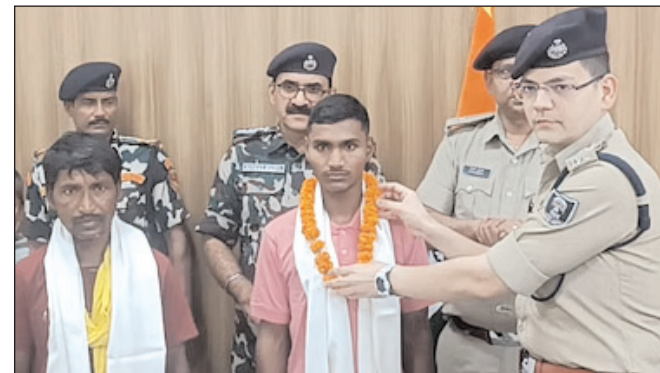
मुंगेर में दो लाख के इनामी नक्सली ने किया आत्मसमर्पण