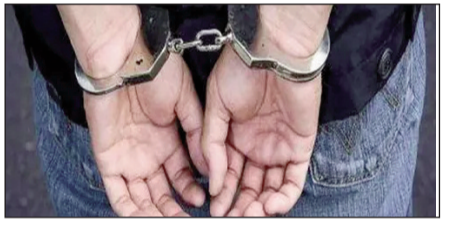
आर्थिक सहायता और बेहतर जीवनशैली का लालच देकर धर्म परिवर्तन के लिए बरगलाया जा रहा था। स्थानीय निवासियों का कहना है कि यह गुप्त गतिविधि काफी समय से संचालित हो रही थी, लेकिन इसकी भनक अब जाकर लगी। कुछ लोगों को फ्लैटों में बार-बार जुट रही भीड़ और बाहरी लोगों की आवाजाही पर शक हुआ, जिसके बाद मामले ने तूल पकड़ा। स्थानीय संघटनों के विरोध और सूचना के बाद पुलिस ने सख्ती दिखाई और गोलमुरी क्षेत्र के दो फ्लैटों पर छापामार, जिससे इस पूरी साजिश का पताफास हो गया। फिलहाल पुलिस पूरे नेटवर्क की कड़ियों को जोड़ने में जुटी है और अन्य सलिलप लोगों की तलाश कर रही है। पुलिस अधिकारियों के अनुसार, प्रथम दृष्टया मामला बेहद गंभीर और योजनाबद्ध प्रतीत होता है। पूछताछ के आधार पर कुछ और ठिकानों की पहचान की जा रही है जहां ऐसी गतिविधियां संचालित हो सकती हैं।

नवबिहार टाइम्स संवाददाता रांची। झारखंड के औद्योगिक नगर जमशेदपुर में धर्मांतरण से जुड़ा एक चौकाने वाला मामला सामने आया है, जिसने पूरे शहर को हिलाकर रख दिया है। गोलमुरी थाना क्षेत्र स्थित दो फ्लैटों में गुप्तचर तरीके से धर्मांतरण की गतिविधियां संचालित की जा रही थीं। जहां करीब 70 लोगों को विभिन्न प्रलोभनों के जरिए धर्मांतरण के लिए बरगलाया जा रहा था। यह खुलासा तब हुआ जब स्थानीय लोगों को इन फ्लैटों में संधिध गतिविधियों की जानकारी मिली। इसके बाद हिंदू संघटनों द्वारा विधि जताया गया और मामले की गंभीरता को देखते हुए पुलिस ने तत्काल छापेमारी कर सात लोगों को हिरासत में ले लिया। फिलहाल इन सभी से थाने में पूछताछ की जा रही है। पुलिस जांच में सामने आया है कि धर्मांतरण की यह पूरी प्रक्रिया एक संगठित नेटवर्क के तहत संचालित हो रही थी, जिसमें न केवल झारखंड के चाईबासा और सरायकेला जिले बल्कि पड़ोसी राज्यों ओडिशा और पश्चिम बंगाल से भी कुछ लोग जुड़े हुए थे। ध्यान देने वाली बात यह है कि इसमें बड़ी संख्या में नाबालिग बच्चों को भी शामिल किया गया था। बताया जा रहा है कि इन बच्चों और अन्य लोगों को झूठे सपने,