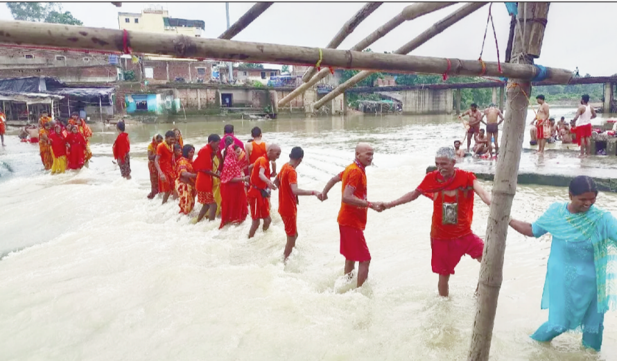
आने की अपील की जा रही है। पिछले एक माह के अंदर छिलका पुल के पास नहाने के क्रम में पटना के एक युवक की पानी के तेज बहाव में डूबकर मौत हो चुकी है।

नवबिहार टाइम्स संवाददाता रामगढ़। पिछले एक माह से लगातार हो रही बारिश से प्रसिद्ध शक्तिपीठ मां छिन्नमस्तिका रजरप्पा मंदिर की दामोदर-भैरवी नदी के छिलका पुल के ऊपर से पानी बह रहा है। नदी की तेज धारा में आसपास के सैकड़ों दुकानें बह गई हैं। गोला की ओर से आने वाले श्रद्धालुओं को छिलका पुल की ओर से आने-जाने से रोक लाया गया है। पुलिस-प्रशासन व रजरप्पा मंदिर न्यास समिति की ओर से भी श्रद्धालुओं को छिलका पुल के ऊपर से बह रहे पानी से मां छिन्नमस्तिका मंदिर में पूजा-अर्चना के लिए नहीं आने की अपील की जा रही है। पिछले एक माह के अंदर छिलका पुल के पास नहाने के क्रम में पटना के एक युवक की पानी के तेज बहाव में डूबकर मौत हो चुकी है।