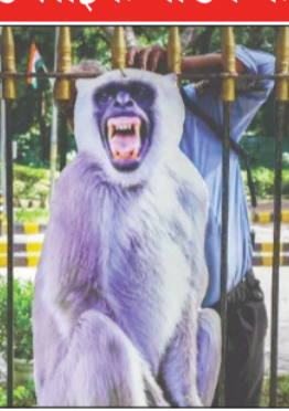
काफी आश्चर्यचकित है कि आखिर वन विभाग के कर्मचारी पदाधिकारी भी वन्यजीवों के साथ ऐसा क्रूर व्यवहार कैसे कर सकते हैं। उन्होंने कहा कि वन्य जीव बंदर, लंगूर सहित अन्य जंगली जानवर अपने भोजन की तलाश में जंगल पर आश्रित रहते हैं। लेकिन जब से जंगल में बाहरी लोगों का अतिक्रमण हुआ है वन्य जीव गांव व शहर की ओर भोजन की तलाश में आने लगे हैं। उन्होंने प्रश्न उठाया कि वन्य जीवों के खाने-पीने वाले फल, फूल, मधु, बेल, तुलसी, वन तुलसी आदि पर लोगों ने कब्जा कर लिया है। ऐसे में वन्य जीव जाएंगे कहाँ। वन्य जीव को जंगल में खाने-पीने की चीज नहीं मिलेगी तो वे निश्चित रूप से उन पर त्वरित एक्शन होना चाहिए। उन्होंने कहा कि इस घटना से वे