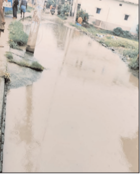
विकल्प नहीं निकाल पाए हैं। नतीजन सड़कों पर जल जमाव की स्थिति यथावत बनी हुई है, जिससे न केवल ग्रामीणों को परेशानी हो रही है, बल्कि आमजन को भी उसे

नवबिहार टाइम्स संवाददाता मसौढ़ी। मसौढ़ी प्रखंड के तिनेरी पंचायत का गोपालपुर मठ गांव में सड़क पर बह रहा नाले का पानी ग्रामीणों के लिए इन दिनों नासूर बन गया है और अब जल जमाव से पानी सड़ कर दुर्गंध देने लगा है। जिससे लोगों का जीना मुहाल हो गया है। अब जल जमाव से अज्ञात बीमारी के भय से लोग सहमे हुए हैं। बताया जाता है कि पिछले 3 महीने से सड़कों पर जल जमाव की स्थिति बनी हुई है, लेकिन अभी तक कोई भी प्रशासनिक अमला, स्थानीय जनप्रतिनिधि इस जल निकासी के मुद्दे पर कोई भी