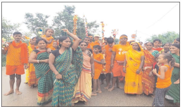
की टोलियां शिव भजनों पर थिरकती हुई, कंधे पर गंगाजल लिए हुए, बाबा बैधनाथ धाम शिवालयों की ओर बढ़ रही हैं। कई स्थानों पर श्रद्धालुओं ने डीजे सिस्टम, ढोल और भजन मंडलियों के साथ

नवबिहार टाइम्स संवाददाता मसौढ़ी। सावन के पावन महीने में तिसरी सोमवारी पर भगवान भोलेनाथ पर जलाभिषेक को लेकर मसौढ़ी से सैकड़ों की संख्या में शिवभक्तों का खाना हुआ। जहां रविवार को मसौढ़ी के सोनकुकरा से तकरबीबन 110 कांवरियों का जत्था खाना हुआ। सड़कों पर नाचते गाते झूमते शिव भक्तों की टोली निकली है। कांवड़ यात्रा के दौरान भक्ति से सराबोर हैं। डाक कांवड़ से लेकर पैदल जत्थों तक शिवभक्त भजनों पर झूमते हुए अपने गंतव्य की ओर बढ़ रहे सावन का यह नजारा हर किसी को आकर्षित कर रहा है। शिवभक्तों