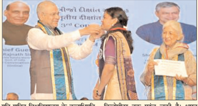
गति शक्ति विश्वविद्यालय के कुलाधिपति अश्विनी वैष्णव ने कहा कि पिछले 11 वर्षों में भारतीय रेलवे में परिवर्तनकारी बदलाव हुए हैं। उन्होंने बताया कि केवल पिछले एक वर्ष में ही रेलवे नेटवर्क में 5,300 किलोमीटर की वृद्धि हुई है और सुरंग निर्माण की कुल लंबाई 368

आह्वान किया कि वे विकसित भारत के निर्माण में अपनी जिम्मेदारी निभाएं। लॉजिस्टिक्स के महत्व को समझते हुए उन्होंने कहा कि जितनी मजबूत हमारी लॉजिस्टिक्स सेवाएं होंगी, उतनी ही मजबूत हमारी सीमाएं रहेंगी। जब देश के एक हिस्से में निर्मित रक्षा उपकरण या सैनिकों के लिए खाद्य सामग्री समय पर सीमा तक पहुंचती है तो सीमा पर तैनात सैनिकों का मनोबल ऊंचा होता है। सरकार की पहलों को रेखांकित करते हुए श्री सिंह ने कहा कि मल्टीमॉडल ट्रांसपोर्ट हब की स्थापना और मिशन मोड भारत के लिए एक गेम चेंजर बताते हुए रक्षा मंत्री ने कहा कि इस क्षेत्र में युवाओं के लिए अपार संभावनाएं हैं और यह विकसित भारत के निर्माण में अहम भूमिका निभाएगा। उन्होंने युवाओं से