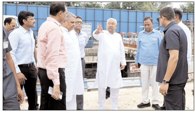
बिहार संग्रहालय के पास निर्माणाधीन टनल का निरीक्षण करते मुख्यमंत्री नीतीश कुमार

* मूल्य : 3.00 रुपये * औरंगाबाद एवं बोकारो से प्रकाशित * www.navbihartime.com