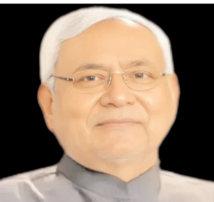
निभाएगा। इस फैसले को लेकर सफाई कर्मचारी संगठनों में उत्साह का माहौल है। बता दें कि सफाई कर्मचारी संघ लंबे समय से आयोग के गठन की मांग को लेकर प्रदर्शन और आंदोलन कर रहा था। इस मांग को देखते हुए नीतीश सरकार ने यह बड़ा निर्णय लिया

पटना। मुख्यमंत्री नीतीश कुमार ने बिहार में सफाई कर्मचारियों के कल्याण और अधिकारों की रक्षा के लिए बिहार राज्य सफाई कर्मचारी आयोग के गठन की घोषणा की है। रविवार सुबह एकस हैंडल से इसकी जानकारी देते हुए उन्होंने बताया कि इस आयोग का गठन सफाई कर्मचारियों के हितों की सुरक्षा, उनके सामाजिक-आर्थिक उत्थान, और कल्याणकारी योजनाओं की निगरानी के लिए किया जाएगा। मुख्यमंत्री ने बताया कि बिहार राज्य सफाई कर्मचारी आयोग में एक अध्यक्ष, एक उपाध्यक्ष और पांच सदस्य होंगे जिनमें एक महिला या ट्रांसजेंडर को शामिल किया जाएगा। यह आयोग सफाई कर्मचारियों के अधिकारों की रक्षा, उनकी शिकायतों के निवारण और कल्याणकारी योजनाओं के प्रभावी कार्यान्वयन के लिए सरकार को सुझाव देगा। इसके साथ ही यह आयोग समाज के वंचित वर्गों को मुख्यधारा में जोड़ने और उनके सामाजिक-आर्थिक विकास में महत्वपूर्ण भूमिका