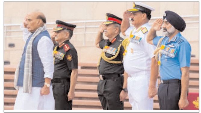
कारगिल विजय दिवस पर शहीद जवानों को श्रद्धांजलि देते रक्षा मंत्री राजनाथ सिंह एवं अन्य

* मूल्य : 3.00 रुपये * औरंगाबाद एवं बोकारो से प्रकाशित * www.navbihartime.com