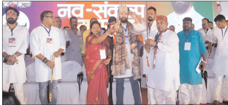
बिहार को पिछड़ा बनाए रखा है। राजद के लोग बिहार को सांप्रदायिकता और जातीयता में बांटकर कहते हैं कि हमारे गठबंधन में एमवाई समीकरण है तो उनको बता दें कि एमवाई समीकरण हमारे यहां भी है जिसमें एम से महिला और वाई से युवा हैं, जो हमारी ताकत हैं। युवा देश की सबसे बड़ी आबादी है और महिला सिर्फ देश ही दुनिया की सबसे बड़ी आबादी है। चिराग पासवान को समाप्त करने का सपना देखने वाले भूल जाते हैं कि

गया जी। गया जी भगवान विष्णु एवं भगवान बुद्ध के ज्ञान स्थली में पांचवीं नव संकल्प महासभा का आयोजन लोजपा रा के द्वारा गया के गांधी मैदान में महासभा आयोजित किया गया जिसमें लोजपा रा के राष्ट्रीय अध्यक्ष सह केन्द्रीय मंत्री चिराग पासवान ने कहा कि आप लोग के बीच एक खास उद्देश्य से आप लोगों के बीच आया हूं। आप लोग जानते हैं कि कुछ समय बाद बिहार में विधानसभा चुनाव होने वाला है। आने वाले पांच साल का भविष्य। आजुकी के 75 साल के बाद भी जब देश के तमाम प्रदेश एक साथ आजाद हुए थे, तब भी हमारी मूलभूत जरूरतें सबसे बड़ी समस्या बनी हुई हैं। दिल्ली-मुंबई जैसे शहर चमचमाते गए, लेकिन मेरा बिहार आज भी पिछड़े राज्यों में है। अब वक्त है जवाबदेही तय करने का, जिम्मेदारी स्थापित करने का और उन लोगों से जवाब मांगने का जिन्होंने 75 सालों में भी