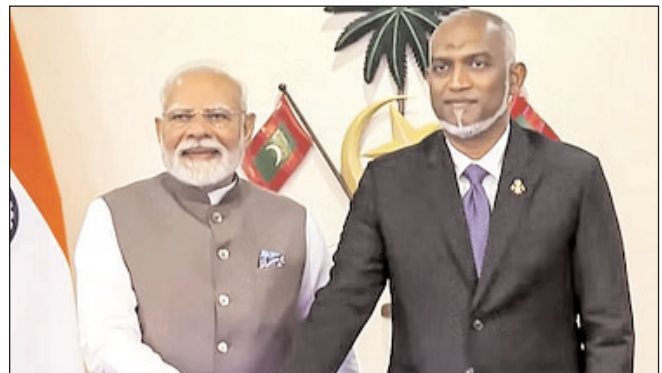
मालदीव के राष्ट्रपति मोहम्मद मुइज्जु से मिले प्रधानमंत्री नरेंद्र मोदी

* मूल्य : 3.00 रुपये * औरंगाबाद एवं बोकारो से प्रकाशित * www.navbihartime.com