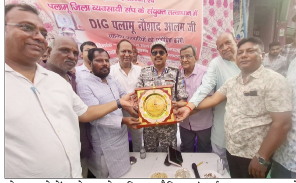
डीआईजी को स्मृति चिह्न भेंट कर किया गया सम्मानित

नवबिहार टाइम्स संवाददाता मैदिनीनगर (पलामू)। व्यवसायी अपने प्रतिष्ठानों में सीसीटीवी कैमरा जरूर लगावाएं। सुरक्षा की दृष्टिकोण से जिन व्यवसायियों को आर्स की जरूरत हो वे एलाई करें। पलामू उपायुक्त से बात कर मुहैया कराया जायेगा। उक्त बातें पलामू क्षेत्र के डीआईजी नौशाद आलम ने कही। वे अखिल भारतीय मध्यदेशीय वैश्य सभा (हलवाई समाज) पलामू व पलामू जिला व्यवसाई संघ के संयुक्त तत्वाधान में आयोजित बैठक में बोल रहे थे। डीआईजी ने कहा कि समाज में वैमनस्यता बढ़ती जा रही है इस पर अंकुश लगाना